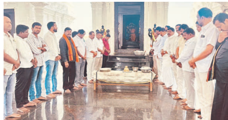
సంగనూరు: కోనాయపల్లి వేంకటేశ్వరస్వామి ఆలయంలో పూజలు చేస్తున్న బీఆర్ఎస్ నాయకులు