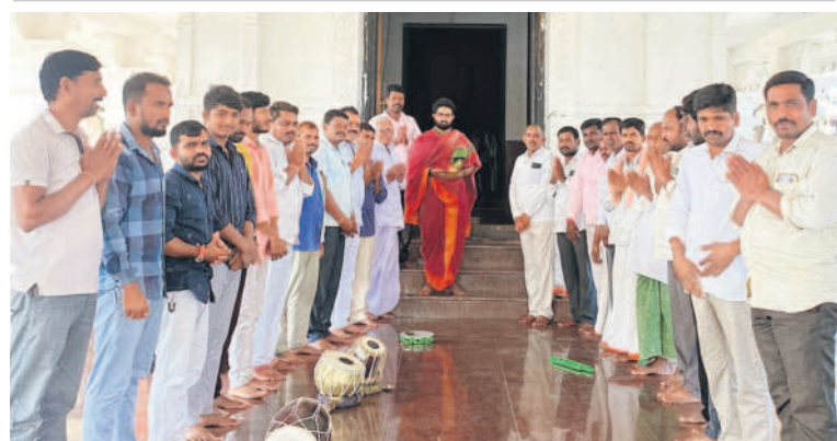
సిద్దిపేటరూరల్: చింతమడక పట్టణరాముడి ఆలయంలో పూజలు నిర్వహిస్తున్న సర్పంచ్, గ్రామస్థులు