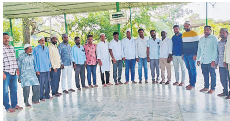
గజ్వేల్లోని దర్గాలో ప్రార్థనలు చేస్తున్న ముస్లింలు