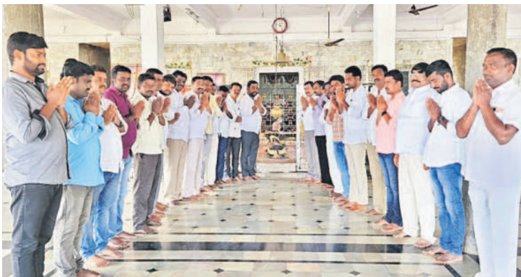
తొగుట మండలం రాంపూర్ స్టేట్ లింగేశ్వరాలయంలో ప్రత్యేక పూజలు చేస్తున్న బీఆర్ఎస్ శ్రేణులు