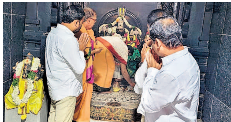
శివ్వంపేట: సీతారామచంద్రస్వామి ఆలయంలో పూజలు చేస్తున్న ఎమ్మెల్యే శంభీపూర్ రాజు