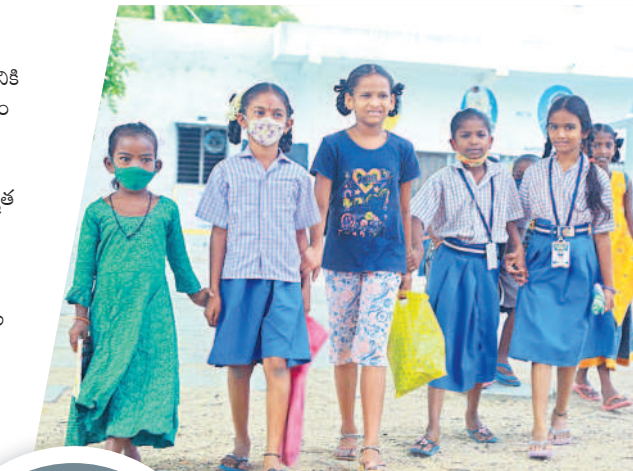
బడిబయటి పిల్లల కోసం ప్రత్యేక సర్వే

విద్యాశాఖ ఆదేశాల మేరకు ఈ నెల 11 నుంచి జనవరి 10 వరకు బడిబయలు ఉన్న పిల్లలను గుర్తించేందుకు సమగ్ర సర్వే నిర్వహిస్తున్నారు. సర్వేను కాంప్లైట్ వారిగా ఉన్న సీఆర్పీలతో పూర్తిస్థాయిలో చేపట్టనున్నారు. అందుకోసం 50 కాంప్లైట్ల పరిధిలోని సీఆర్పీలను వినియోగిస్తున్నారు. 6 నుంచి 19 సంవత్సరాల మధ్య వయసున్న బడి బయటి పిల్లలను గుర్తించి ప్రతి రోజు ప్రబంధ్ పోర్టల్లో నమోదు చేస్తారు. జిల్లాలో బడిబయటి పిల్లలను పూర్తిస్థాయిలో పాఠశాలలో చేర్చేందుకు లక్ష్యాగా పనిచేస్తారు. -3. నారాయణరెడ్డి, డీఈఓ, యాదాద్రి భువనగిరి జిల్లా