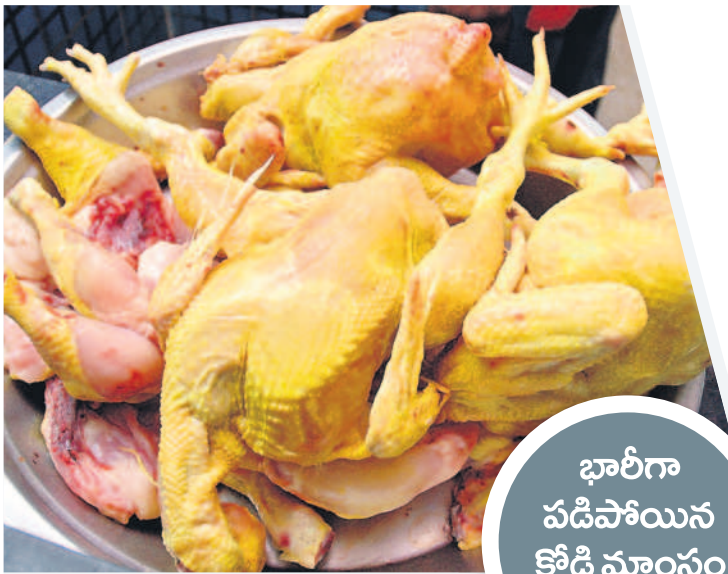
భారీగా పడిపోయిన కోడి మాంసం ధరలు