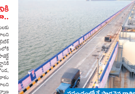
ప్రపంచంలోనే పొడవైన రాతికట్టడం

నందికొండ, డిసెంబర్ 9 : తెలంగాణ, ఆంధ్రా రాష్ట్రాలకు సాగు, తాగు నీటిని అందిస్తూ అన్నపూర్ణా విరాజిల్లుతున్న నాగార్జునసాగర్ ప్రాజెక్టుకు పునాదిదాయిపడి నేటికి 68 ఏండ్లు పూర్తయ్యాయి. దాంతో సాగర్ ప్రాజెక్ట్ ప్రస్తుతం 69వ వసంతంలోకి అడుగిడింది. రైతులు కరువుతో విలవిల్లాడుతున్న సమయంలో ముక్త్యాల కోట రాజైన రాజా రామగోపాల్ కృష్ణ మహేశ్వరప్రసాద్ ఆలోచనతో నాగార్జునసాగర్ ప్రాజెక్ట్ నిర్మాణానికి బీజం పడింది. 1908న కృష్ణా నదిపైన పులిచింతల వద్ద ప్రాజెక్ట్ కట్టేందుకు అనువుగా ఉండని బ్రిటిష్ ఇంజనీర్లు కర్నూల్ ఎల్.వి. సీటీ మార్టింగ్లె తెలిపినప్పటికీ కొన్ని అనివార్య కారణాల వల్ల అప్పట్లో ప్రాజెక్ట్ నిర్మాణం ఆగిపోయింది. అనంతరం ఖోస్లా కమిటీ సూచనలతో 1954 డిసెంబర్ 17న అప్పటి గవర్నర్ త్రివేది నాగార్జునసాగర్ ప్రాజెక్ట్ నిర్మాణాన్ని చేపట్టనున్నట్లు ప్రకటించారు. 1955 డిసెంబర్ 10న ఆనాటి ప్రధాని జవహర్ లాల్ నెహ్రూ ప్రాజెక్ట్ నిర్మాణానికి నందికొండలోని పైలాన్ కాలనీలో పిల్లర్ ఏర్పాటు చేసి శంకుస్థాపన చేశారు.