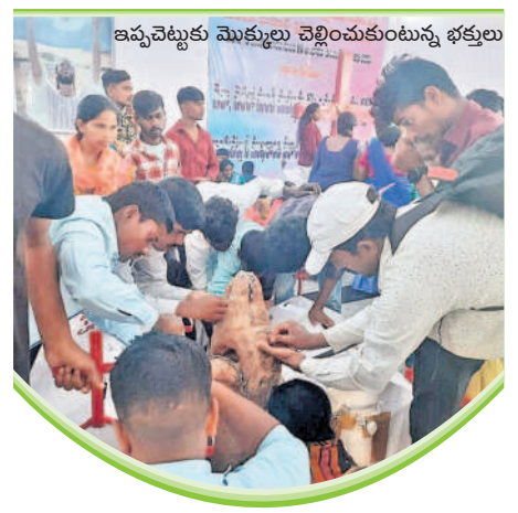
ఇప్పవెట్టుకు మొక్కులు చెల్లించుకుంటున్న భక్తులు