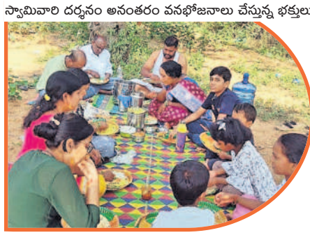
స్వామివారి దర్శనం అనంతరం వనభోజనాలు చేస్తున్న భక్తులు