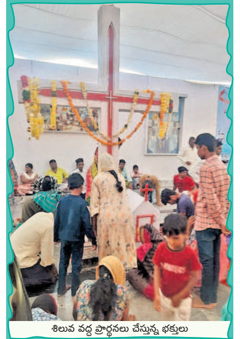
శిలువ వద్ద ప్రార్థనలు చేస్తున్న భక్తులు

ధారూరు, డిసెంబర్ 9 : ధారూరు మండల పరిధిలోని ధారూరు స్టేషన్- డోర్నాల్ గ్రామాల మధ్య ఉన్న మెథడిస్టు క్రీస్టియన్ జాతరకు భక్తులు శనివారం పోటీపడ్డారు. ధారూరు మెథడిస్టు జాతరకు వివిధ ప్రాంతాల నుంచి వేలాది మంది భక్తులు కాలినడకన తరలివస్తున్నారు. మెథడిస్టు జాతర రేవు(ఆదివారం) ముగింపు ఉండడంతో శనివారం అధిక సంఖ్యలో భక్తులు తరలివచ్చారు. యాత్రికులు జాతర ప్రాంగణంలో రెండు రోజులు ఉండేందుకు గుడారాలను ఏర్పాటు చేసుకున్నారు. ఏస్తుక్రీస్తు శిలువ వద్ద ప్రత్యేక ప్రార్థనలు చేసి మొక్కులు చెల్లించుకున్నారు. ప్రార్థన మందిరంలో ప్రార్థనలు చేసి బిబిఎల్ దైవ సందేశాన్ని తెలుగు, కన్నడ భాషలలో విని పించారు. వివిధ ప్రాంతాల నుంచి వచ్చిన భక్తులు సందేశాన్ని వింటూ ఏనుప్రభువును తలచుకున్నారు. భక్తులు శిలువ వద్ద కొవ్వొత్తులను వెలిగించి ప్రత్యేక ప్రార్థనలు చేశారు. ఆదివారం మెథడిస్టు జాతర ముగియనున్నందున భక్తులు అధిక సంఖ్యలో వచ్చే అవకాశాలున్నాయని నిర్వాహకులు తెలుపుతున్నారు. యాత్రికులకు ఎలాంటి ఇబ్బందులు తలెత్తకుండా పోలీసులు భారీ బందోబస్తు చేస్తున్నారు.