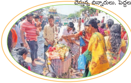
శివలింగానికి అభిషేకం చేస్తున్న బిన్నారలు, పెద్దలు