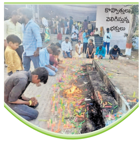
కొవ్వొత్తులు వెలిగిస్తున్న భక్తులు