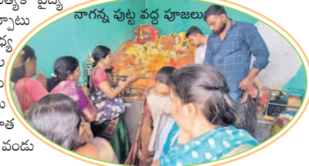
నాగన్న పుట్ట వద్ద పూజలు

స్వయంభు శివలింగానికి పూజలు నిర్వహిస్తున్న భక్తులు సమస్య తలెత్తకుండా మంచాల పారిశుధ్య పూజలు నిర్వహిస్తున్న భక్తులు సమస్య తలెత్తకుండా మంచాల ఎంపీడీవో శ్రీనివాస్ ఆధ్వర్యంలో సిబ్బందిని నియమించారు. ఇలా హింపట్లం నుంచి భక్తుల సౌకర్యార్థం బుగ్గరామలింగేశ్వరస్వామి ఆలయం వరకు గంటకు ఒక ఆర్టీసీ బస్సును నడిపిస్తున్నారు. జాతరకు వచ్చే భక్తులు స్వామివారిని దర్శించుకున్న అనంతరం అక్కడే వండు కొని వన భోజనాలను చేస్తున్నారు. అనంతరం ఆట వస్తువులు, స్వీట్లు కొనుగోలు చేస్తున్నారు.