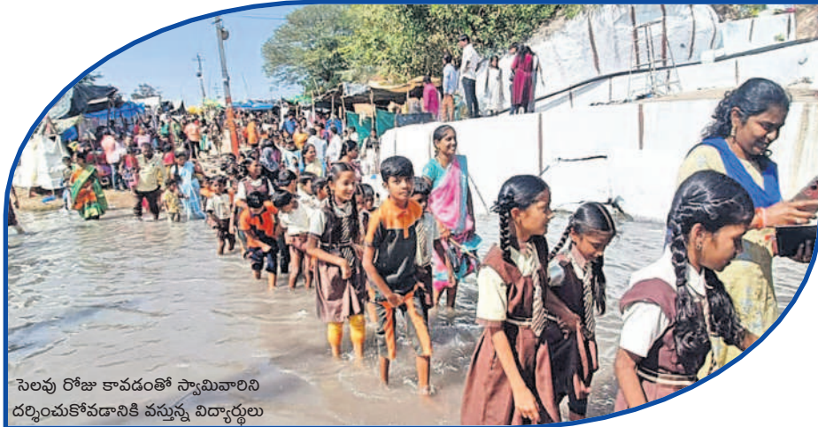
సెలవు రోజు కావడంతో స్వామివారిని దర్శించుకోవడానికి వస్తున్న విద్యార్థులు