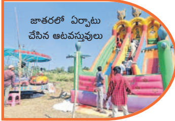
జాతరలో ఏర్పాటు చేసిన ఆటవస్తువులు