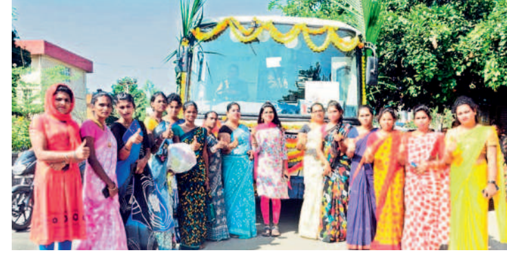
జనగామలో బస్సు ముందు నిల్వని విక్రీతి సింబల్ చూపిస్తున్న ట్రాన్స్ జెండర్స్