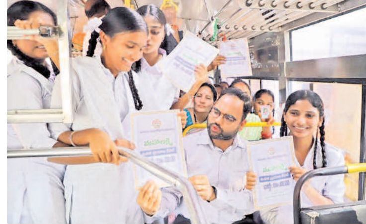
బాలికలతో మామబాబాద్ కలెక్టర్ శశాంక