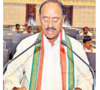
రేవంకెరెడ్డి పరకాల ఎమ్మెల్యే