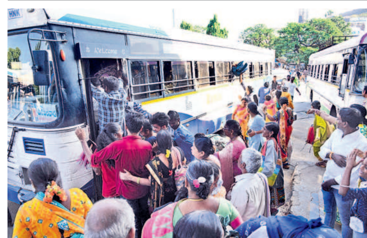
మహిళలతో కోలాహలంగా హనుమకొండ బస్ స్టేషన్