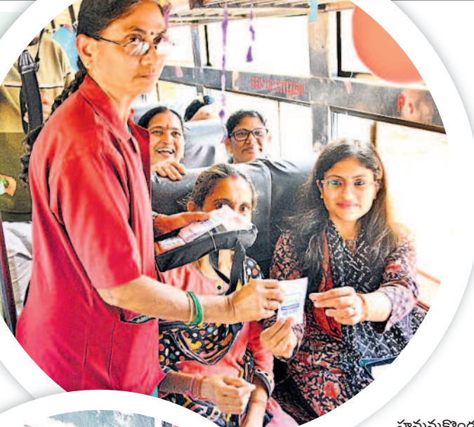
హనుమకొండ కలెక్టర్ సిక్తా పట్నాయక్ జీరో టికెట్ ఇస్తున్న కండక్టర్

తెలంగాణ పాలిమెర్ వరకు.. ఈ ప్రజా విప్లవ పార్టీకి అన్ని సందేహం అవసరం లేదు. ఎందుకంటే ఎన్ని కిలోమీటర్లు అయినా ఉచితమే. తెలంగాణ పాలిమెర్ లో ఉన్నంతవరకు ఏ మహిళాకూ టికెట్ తీసుకోవాలి అవసరం లేదు. ట్రాన్స్ జెండర్లకు కూడా అవసరం లేదని తేల్చేశారు. ఏటీఎం వెళ్లాలి తెలుగు బస్సుల్లో ఎక్స్ ప్రెస్ మహిళలకు టికెట్ ఉచితమే. కాకుంటే తెలంగాణ రాష్ట్ర పాలిమెర్ వరకు మాత్రమే. ఆ తర్వాత టికెట్ తీసుకోవాలి ఉంటుంది చెబుతున్నారు. కండక్టర్లకు సూచనలు.. ఈ పథకం అమలు చేశారు. తెలంగాణ వ్యాప్తంగా ఉన్న ఆర్టీసీ సిబ్బందికి ప్రత్యేకంగా కొన్ని నిబంధనలు ఉన్నాయి. ప్రయాణికుల రద్దీ వివరంగా పేర్కొంటే వల్ల తీసుకోవాలి జాగ్రత్తలను సూచించడంతో పాటు ఎలాంటి విసుగును ప్రదర్శించకుండా బాధ్యతతో వ్యవహరించాలని ఆర్టీసీ ఉద్యోగి