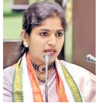
మామిదాల యశస్వినీ పాలకల్ నియోజకవర్గ ఎమ్మెల్యే