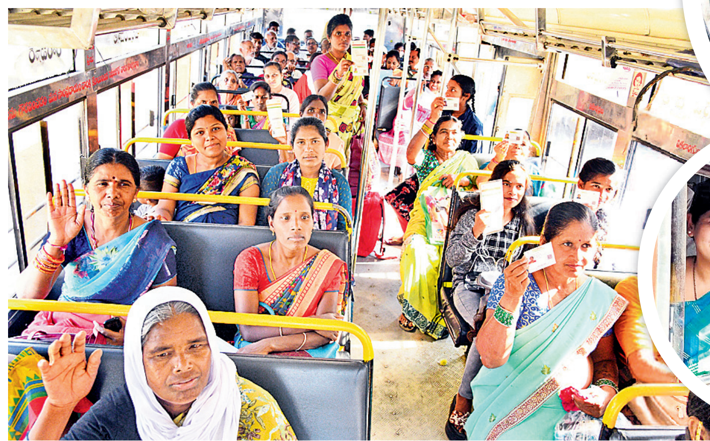
హనుమకొండలో ఆర్టీసీ బస్సులో ఉచితంగా ప్రయాణం చేస్తూ ఆధారకార్లు చూపిస్తున్న మహిళలు