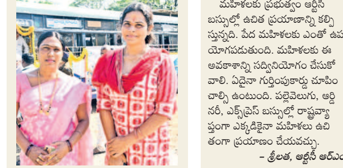
మహిళలు ఉచిత ప్రయాణాన్ని ఉపయోగించుకోవాలి..