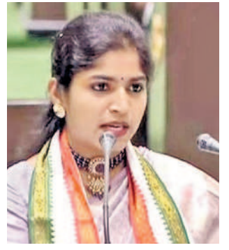
మామిదాల యశస్వినీ పాలకల్లి నియోజకవర్గ ఎమ్మెల్యే