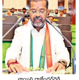
నాయిని రాజేందరరెడ్డి వరంగల్ పశ్చిమ ఎమ్మెల్యే