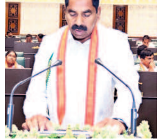
కే.ఆర్ నారాజు వర్సన్నపేట ఎమ్మెల్యే