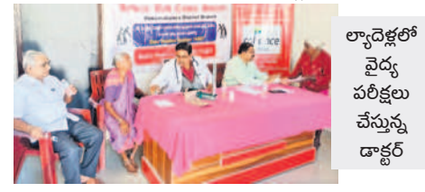
ల్యాబ్ కేజీలో వైద్య పరీక్షలు చేస్తున్న డాక్టర్