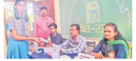
మాక్ అసెంబ్లీలో పాల్గొన్న విద్యార్థులు