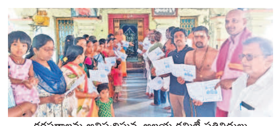
కరపత్రాలను ఆవిష్కరిస్తున్న ఆలయ కమిటీ ప్రతినిధులు