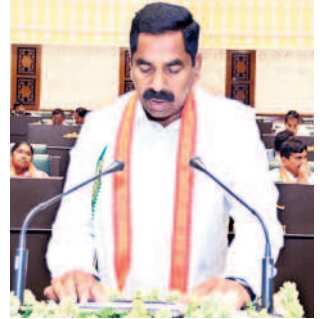
కే.ఆర్ నారాజు వర్సన్నపేట ఎమ్మెల్యే