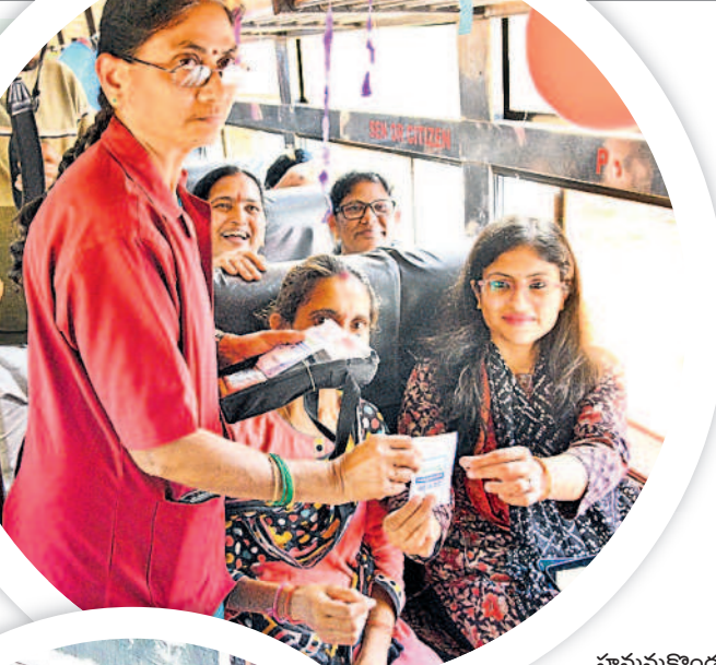
హనుమకొండ కలెక్టర్ సిక్తా పట్నాయక్ జీరో టికెట్ ఇస్తున్న కండక్టర్

కండక్టర్లకు సూచనలు.. ఈ పథకం అమలు చేసే.. తెలంగాణ వ్యాప్తంగా ఉన్న ఆర్టీసీ సిబ్బందికి ప్రత్యేకంగా కొన్ని నిబంధనలు ఉన్నాయి. ప్రయాణికుల రద్దీ వివేకంగా వేరగడం వల్ల తీసుకోవాల్సిన జాగ్రత్తలను సూచించడంతో పాటు ఎలాంటి విసుగును ప్రదర్శించకుండా బాధ్యతతో వ్యవహరించాలని ఆర్టీసీ ఉద్యోగి