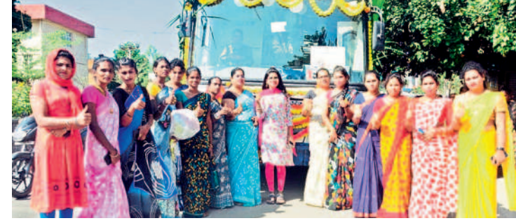
జనగామలో బస్సు ముందు నిల్వని విక్రీ సింబల్ చూపిస్తున్న ట్రాన్స్ జెండర్స్