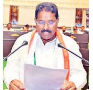
దొంతి మాధవరెడ్డి సర్పంచి ఎమ్మెల్యే