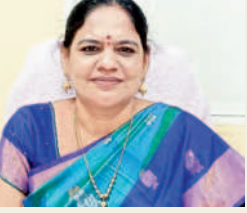
మహిళలు ఉచిత ప్రయాణాన్ని ఉపయోగించుకోవాలి..