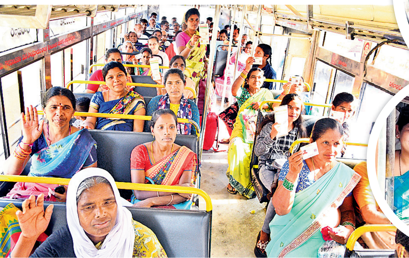
హనుమకొండలో ఆర్టీసీ బస్సులో ఉచితంగా ప్రయాణం చేస్తూ ఆధారకార్లు చూపిస్తున్న మహిళలు