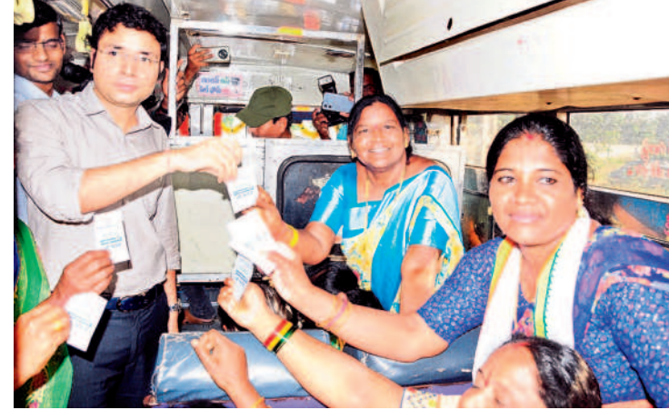
మహిళలకు జీరో టికెట్ ఇస్తున్న జయశంకర్ భూపాలపల్లి కలెక్టర్ భవేశ్మి