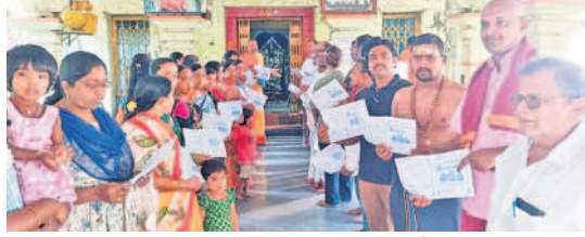
కరపత్రాలను అవిష్కరిస్తున్న ఆలయ కమిటీ ప్రతినిధులు