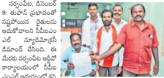
వినతిపత్రం అందజేస్తున్న రైతు సంఘం నాయకులు

సర్వపేట, డిసెంబర్ 9: తుఫాన్ ప్రభావంతో నష్టపోయిన రైతులను ఆదుకోవాలని సీపీఐఎం ఎల్ న్యూడెమోక్రసీ డిమాండ్ చేసింది. ఈ మేరకు సర్వపేట ఆర్డీవో కార్యాలయంలో సీపీఐఎం ఎంఎల్ ఆధ్వర్యంలో శనివారం ధర్మా నిర్వహించి అధికారులకు వినతి