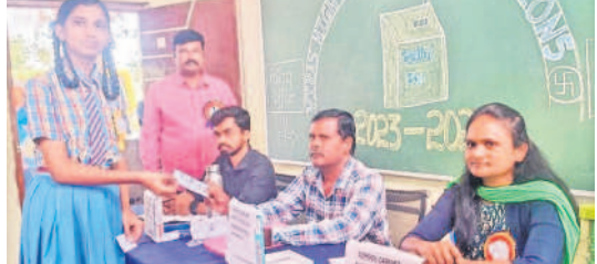
మాక్ అసెంబ్లీలో పాల్గొన్న విద్యార్థులు