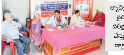
ల్యాబ్ వీకల్లో వైద్య పరీక్షలు చేస్తున్న డాక్టర్