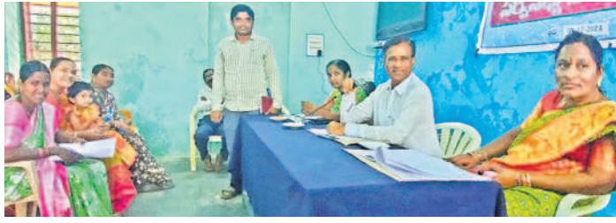
ఖానాపురం మండల సర్వసభ్య సమావేశంలో మాట్లాడుతున్న ఎంపీపీ ప్రకాశ్ రావు

మండల సర్వసభ్య సమావేశంలో మాట్లాడుతున్న ఎంపీపీ ప్రకాశ్ రావు