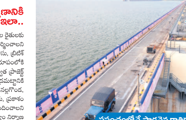
ప్రపంచంలోనే పొడవైన రాతికట్టడం