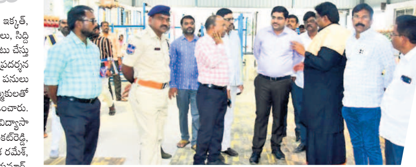
భూదాన్ పోచంపల్లిలోని బాలాజీ ఫంక్షన్ హాల్ లో ఏర్పాటైన పరిశీలింపు కలెక్టర్ హనుమంతు కె జెండగ్