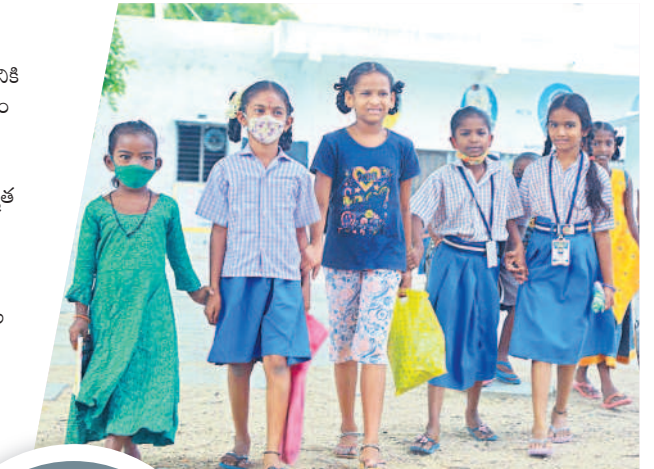
బడిబయటి పిల్లల కోసం ప్రత్యేక సర్వే

నల్లగొండ జిల్లా పెద్దపూర్ మండల కేంద్రానికి 20 కిలోమీటర్ల దూరంలో నందికొండ గ్రామం వద్ద కృష్ణానదిపై బహుళార్థక సాధక ప్రాజెక్టుగా నాగార్జునసాగర్ ను నిర్మించారు. ఆధునిక దేవాలయంగా కీర్తించబడుతున్న మానవ నిర్మిత అతి పెద్ద రాతికట్టడం కావడంతో ఈ ప్రాజెక్ట్ చరిత్ర పుటల్లో నిలుస్తోంది. ఈ ప్రాజెక్ట్ తో తెలంగాణ, ఆంధ్రా రాష్ట్రాల్లోని 25 లక్షల ఎకరాల భూమి సాగులోకి వస్తుండడంతో వేల రైతు కుటుంబాలు సాడి పంటలతో సంతోషంగా జీవనం సాగిస్తున్నాయి. నాగార్జునసాగర్ ప్రాజెక్ట్ ద్వారా చేపడకున్న విద్యుత్ ఉత్పత్తితో పరిశ్రమల మనుగడ కోససాగుతుండడంతో వేల మంది నిరుద్యోగులకు ఉపాధి అవకాశాలు కలుగుతున్నాయి.