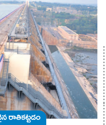
ప్రపంచంలోనే పొడవైన రాతికట్టడం

1930లో నల్లగొండ, ఖమ్మం జిల్లాల రైతులకు సాగునీటిని అందించేందుకు ప్రాజెక్ట్ నిర్మించాలని భావించిన ఆనాటి వైజం నవాబు మద్రాసు, బ్రిటీష్ ప్రభుత్వాన్ని అనుమతి కోరగా అది కార్యరూపంలోకి రాలేదు. దేశానికి స్వాతంత్ర్యం వచ్చిన తర్వాత ప్రాజెక్ట్ నిర్మాణానికి ఆలోచన మొదలైంది. సముద్రమట్టానికి 548 అడుగుల ఎత్తులో అనకట్ట నిర్మించి నల్లగొండ, సూర్యాపేట, ఖమ్మం, కృష్ణా, గుంటూరు, ప్రకాశం జిల్లాలకు సాగునీటిని అందించాలని భావించారు. నాగార్జునసాగర్ డ్యాం నిర్మాణ ప్రాంతాన్ని మొదటగా బీసీ ఇంజనీర్ అలినవాట్ జంగ్ సర్వే చేసి పథశాస్త్ర రూపొందించారు. డ్యాంతో పాటు ఎడమ, కుడి కాల్వలు, ప్రధాన డ్యాం వద్ద జలవిద్యుత్ కేంద్రాలను ఏర్పాటు చేసి 1.68 లక్షల కిలోవాట్ల విద్యుత్తును ఉత్పత్తి చేసేలా డ్యాంను నిర్మించారు.