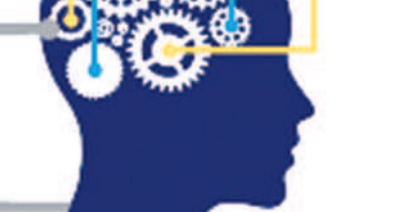
విద్యార్థులకు ఆసక్తి పెరిగింది.. జిల్లాలో ఏటా నిర్వహిస్తున్న సైన్స్ ఫెయిర్ కు ఆదర్శం పెరిగింది. ఇన్వెస్ట్ కు ఎంపికయ్యే విద్యార్థుల సంఖ్య పెరుగుతున్నది. సూతన అవిష్కరణలపై విద్యార్థులు ఆసక్తి ప్రదర్శిస్తున్నారు. ప్రభుత్వ, ప్రైవేట్ పాఠశాల విద్యార్థులు ప్రాజెక్టుల రూపకల్పనలో ప్రత్యేక శ్రద్ధ చేపడుతున్నారు.

10 సంవత్సరాల నుంచి 14 సంవత్సరాల వయసులోపు విద్యార్థులను జూనియర్ గా, 15 సంవత్సరాల వయసు