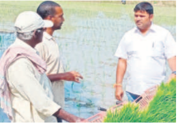
దాకు లోపాలను నివారించవచ్చు. • వరిపై కాండంతోలును పురుగు ప్రభావం ఉంటుంది. నారుమడి చేసిన 15 రోజులకోక సారి కిలో కారోఫ్యూరాన్ 3జి గుళికలను చల్లాలి. రెండోవిడతగా నాలువేసే వారం ముందు మరోసారి చల్లాలి.

సత్తుపల్లి/ సారపాక, డిసెంబర్ 10 : రైతులు చూసేసాగి సాగుకు సన్నద్ధమవుతున్నారు. ప్రస్తుతం చలి తీవ్రత పెరగడంతో వరినారుకు తెగుళ్లు సోకే అవకాశం ఉంది. ఈ తరుణంలో జాగ్రత్తలు పాటిస్తే ఆరోగ్యవంతమైన పంట పొందవచ్చని వ్యవసాయ అధికారులు రైతులకు సూచిస్తున్నారు. ఈసారి వాన కాలం కంటే యాసంగిలో రైతులు వరిపంటను అధికంగా సాగుచేసే అవకాశం ఉంది. ఈక్రమంలో లైసెన్సు కలిగిన దుకాణాల నుంచి రైతులు విత్తనాలు కొనుగోలు చేసి రకీడును భద్రపర్చుకోవాలని అధికారులు సూచిస్తున్నారు. విత్తనాలు మొలకెత్తకుంటే దుకాణదారుడిపై చర్యలు తీసుకునే అవకాశం ఉంటుందని చెబుతున్నారు.