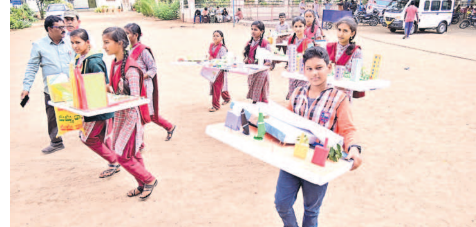
విద్యార్థులు ప్రాజెక్టులను పోటీ పోటీగా తెలుపుతున్నారు