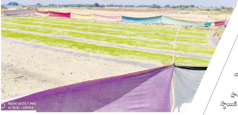
పొలంలో కొయ్యలను కాల్చడం అత్యంత ప్రమాదకర స్థాయికి చేరుకున్నదని శాస్త్రవేత్తలు, సామాజికవేత్తలు ఆందోళన

ఉజ్జూర్, డిసెంబర్ 10 : అన్నదాతలకు పంటలు పండించడం సాహసమైతే.. దానికి ముందు పశుపక్షాలను తట్టుకుని నారు పెంచడం అంతకంటే పెద్ద సాహసం. ఉజ్జూర్ మండల కేంద్రం నుంచి సంద్యోగినిక వెళ్లే రహదారి పక్కనే ఉన్న పొలంలో ఓ క్షేత్ర వరి నారు పెంచుతున్నారు. వరినారు పశువుల బారిన పడకుండా విభిన్నంగా ఆలోచించాడు. ఎటువంటి ఖర్చు చేయకుండా ఇంట్లో పాత చీరలను తెచ్చి వరి నారుకు రక్షణగా ఏర్పాటు చేశాడు. ఆ నారు పెరిగి పెద్దదయ్యింది. మరొకొద్ద రోజుల్లో వరి నాట్లు వేసినందుకు సిద్ధంగా ఉన్నది. ఈ దృశ్యాన్ని సమస్త తెలంగాణ ఖిక్ మనవిందింది.