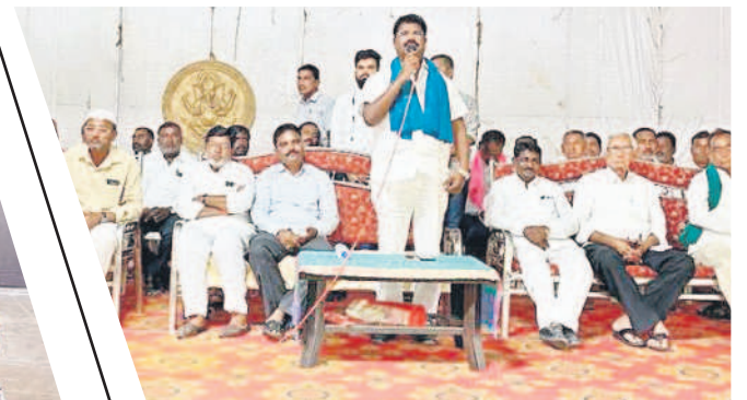
సమావేశంలో మాట్లాడుతున్న మాజీ ఎమ్మెల్యే హన్మంతి శిందే