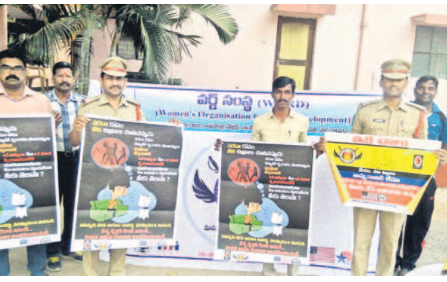
మానవ లక్ష్య రవాణా పోస్టును ఆవిష్కరిస్తున్న పోలీసు అధికారులు (ఫైల్)