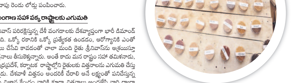
దాదాపు రెండు లోడుల పంటపొంపి.