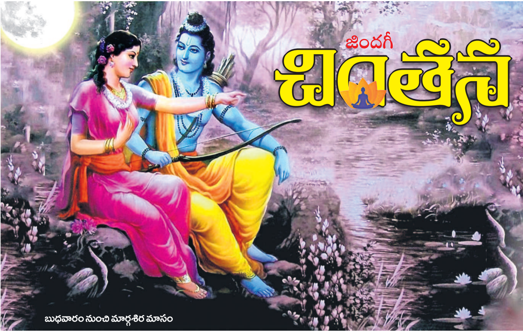
బుధవారం నుంచి మార్గశిర మాసం