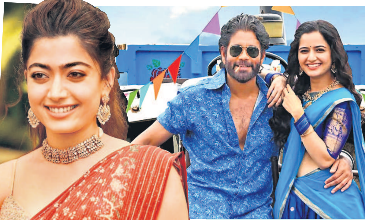
నాగార్జున్, ఆషికా రంగనాథ్

ఎప్పుడెప్పుడా అని ప్రేక్షకులు ఆసక్తిగా ఎదురుచూస్తున్న సినిమాలో 'సలార్' ది మొదటిసారి. ప్రభాస్, ప్రశాంత్ సీట్ కలయికలో వస్తున్న ఈ పాన్ ఇండియా యాక్షన్ డ్రామా ఈ నెల 22న విడుదల కానుంది. ఆదివారం సెన్సార్ కార్యక్రమాలు పూర్తి చేసుకున్న ఈ చిత్రానికి ఏ సర్టిఫికేట్ జారీ అయ్యింది. యాక్షన్ పార్ట్ ఎక్కువ కావడమే ఏ సర్టిఫికేట్ రావడానికి కారణమని తెలుస్తున్నది. మరో విషయం ఏంటంటే.. ఈ సినిమా నిడివి 2 గంటల 55 నిమిషాలే. 'సలార్' కథను రెండున్నర గంటల్లో చెప్పలేం.. ఇది సంపూర్ణంగా చెప్పాలంటే మినీమమ్ అయిదు గంటలైనా పడుతుంది. అందుకే రెండు భాగాలుగా తీస్తున్నారని అని ప్రశాంత్ సీట్ గతంలో చెప్పారు. ఇప్పుడు తొలి భాగమే 2 గంటల 55 నిమిషాలు రావడం ఫిలింఫేర్ వర్సెస్ యాంక్షన్ అయింది. సినిమా నిడివి ఎంతన్నా బావుంటే జనం బ్రహ్మరథం పడతారనేది నిజం. దానికి గతంలో చాలా సినిమాలను ఉదాహరణగా చెప్పాల్సింది. రీసెంట్ టైమ్స్ లో 'యానిమల్' కూడా 3 గంటల 28 నిమిషాలు. ఏది ఏమైనా 'సలార్' పాన్ ఇండియా రికార్డులను తిరిగిరాయడం జ్ఞానుమన అభిమానులు గట్టిగా నమ్ముతున్నారు.