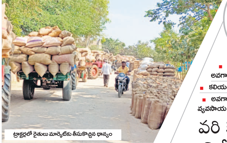
ట్రాక్టర్లలో రైతులు మార్కెట్ కు తీసుకొచ్చిన ధాన్యం