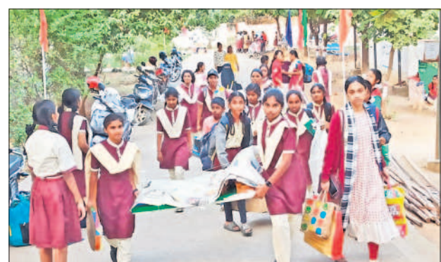
ఎగ్జిబిట్లతో ప్రదర్శన కేంద్రానికి చేరుకుంటున్న విద్యార్థులు

బాలబాలికలకు వేర్వేరుగా క్యాంపస్ ను ఏర్పాటు చేసి వసతి సౌకర్యం కల్పించనున్నారు. ఇప్పటికే తమ ఎగ్జిబిట్లతో విద్యార్థులు ప్రదర్శన కేంద్రానికి చేరుకున్నారు. రిజనల్ కోఆర్డినేటర్ విద్యారాణి ఏర్పాట్లను పర్యవేక్షించారు.