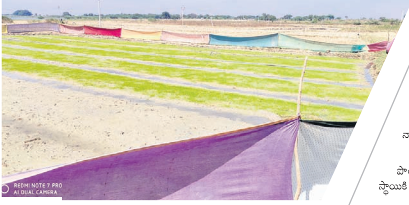
పొలంలో కోయ్యలను కాల్చడం అత్యంత ప్రమాదకర స్థాయికి చేరుకున్నదని శాస్త్రవేత్తలు, సామాజికవేత్తలు ఆందోళన

ఉజ్జూర్, డిసెంబర్ 10 : అన్నదాతలకు పంటలు పండించడం సామాన్యమే. దానికి ముందు పశుపక్షులను తట్టుకుని నారు పెంచడం అంతకంటే పెద్ద సాహసం. ఉజ్జూర్ మండల కేంద్రం నుంచి సంద్యోగిణి వెళ్ల రహదారి పక్కనే ఉన్న పొలంలో ఓ కైతు వరి నారు పెంచుతున్నాడు. వరినారు పశువుల బారిన పడకుండా విధిస్తున్నారా అలోచించాడు. ఎటువంటి ఖర్చు చేయకుండా ఇంట్లో పాత చీరలను తెచ్చి వరి నారుకు రక్షణగా ఏర్పాటు చేశాడు. ఆ నారు పెరిగి పెద్దదయ్యింది. మరొకటి రోజుల్లో వరి నాల్గు వేసినందుకు సైదంగా ఉన్నది. ఈ దుష్ప్రయోగ నమస్తే తెలంగాణ ట్విట్ మనిషివారిది.