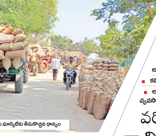
ట్రాక్టర్లో రైతులు మార్కెట్ కు తీసుకొచ్చిన ధాన్యం