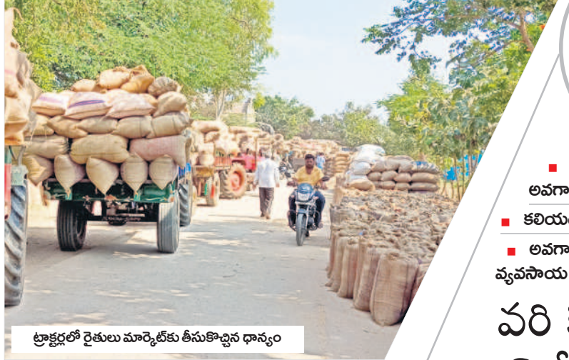
ట్రాక్టర్లతో రైతులు మార్కెట్ కు తీసుకొచ్చిన ధాన్యం

నవంబరు, డిసెంబర్ 10 : నవంబరు మాసానికి యార్డుకు ఆదివారం రైతులు భారీగా ధాన్యాన్ని తీసుకొచ్చారు. గ్రామాల్లో వరికోతలు ఉపయోగపడకం, వరి ధాన్యానికి మంచి ధర లభిస్తుండటంతో రైతులు నేరుగా మార్కెట్ యార్డుకు ధాన్యం తీసుకువచ్చి విక్రయించేందుకు మొగ్గు చూపుతున్నారు. ఈ సీజన్లో వరి సన్నరకాలతోపాటు, డొడ్డు రకం ధాన్యానికి సైతం ధర అధికంగా పలకడంతో కొనుగోలు కేంద్రాలకంటే మార్కెట్లోనే అధిక ధర లభిస్తుందని రైతులు అభిప్రాయపడుతున్నారు. గత బహువారం వాతావరణ పరిస్థితుల కారణంగా ధాన్యానికి టెండర్లు చేయలేకపోవడంతో ధాన్యం నిల్వలు మార్కెట్లో అధికమయ్యాయి. రెండు రోజుల కిందట టెండర్లు చేసిన ధాన్యం లిక్విడ్ చేయలేకపోవడంతో ధాన్యం బాగా పేరుకుపోయింది. ఆదివారం ఒక్క రోజే వివిధ గ్రామాల 22వేల వరి ధాన్యం నిల్వలు రావడంతో ధాన్యం మార్కెట్లో అసెంబ్లీ చేయడానికి కూడా ఇబ్బందికరంగా మారింది. చివరికి సాయంత్రం ధాన్యాన్ని అసెంబ్లీ అధికారులు పోరవ తీసుకొని ధాన్యాన్ని అసెంబ్లీ చేయించారు. ధాన్యం అధికంగా రావడంతోనే టెండర్లు చేయలేదని మార్కెట్ కార్యదర్శి రమేశ్ కుమార్ తెలిపారు. గత వారంలో నిర్వహించి టెండర్లో ఆర్ఎన్ఆర్ సన్నరకం ధాన్యానికి క్వింటాళ్ల రూ.3,319 అధిక ధర లభించినట్లు తెలిపారు. అలాగే డొడ్డు రకం(1010) ధాన్యానికి క్వింటాళ్ల రూ.3,058 ధర లభించినట్లు ఆయన తెలిపారు. సోమవారం టెండర్లు చేసిన రైతులకు ఎలాంటి ఇబ్బందులు తలెత్తకుండా చర్యలు తీసుకుంటామని తెలిపారు.