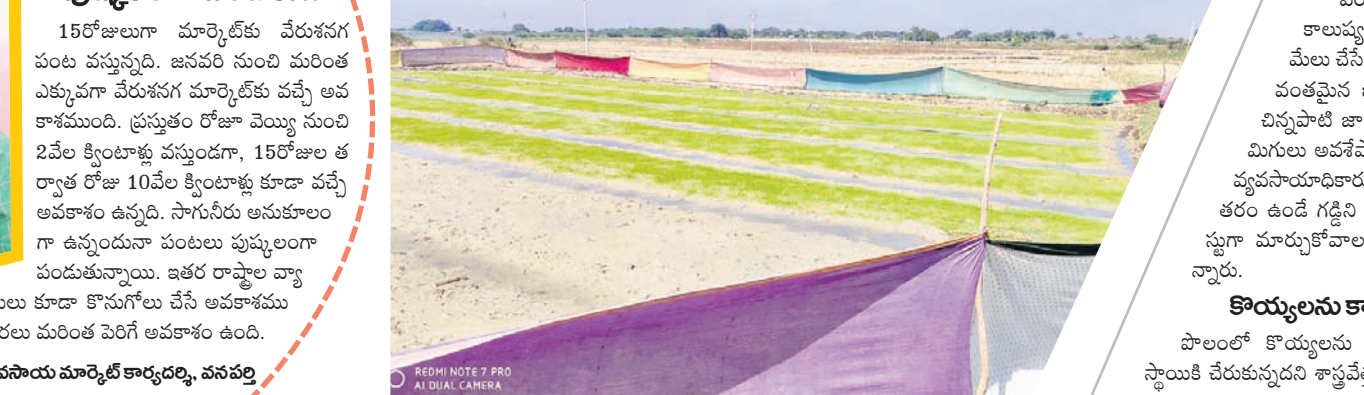
పొలంలో కొయ్యలను కాల్వడంతో అత్యంత ప్రమాదకర స్థాయికి చేరుకున్నదని శాస్త్రవేత్తలు, సామాజికవేత్తలు ఆందోళన

ఊట్యూర్, డిసెంబర్ 10 : అన్నదాతలకు పంటలు పండించడం సాహసమైతే.. దానికి ముందు పశుపక్షాలను తట్టుకుని నారు పెంచడం అంతకంటే పెద్ద సాహసం. ఊట్యూర్ మండల కేంద్రం నుంచి సంద్యూర్ కు వెళ్లే రహదారి పక్కనే ఉన్న పొలంలో ఓ ట్రెక్ వరి నారు పెంచుతున్నారు. వరినారు పశువుల బారిన పడకుండా విభిన్నంగా ఆలోచించాడు. ఎటువంటి ఖర్చు చేయకుండా ఇంట్లో పాత చీరలను తెచ్చి వరి నారుకు రక్షణగా ఏర్పాటు చేశాడు. ఆ నారు పెరిగి పెద్దదయ్యింది. మరికొద్ది రోజుల్లో వరి నాల్గు వేసినందుకు సిద్ధంగా ఉన్నది. ఈ దుష్ప్రయోగ సమస్య తెలంగాణ క్షితి మనవిందింది.