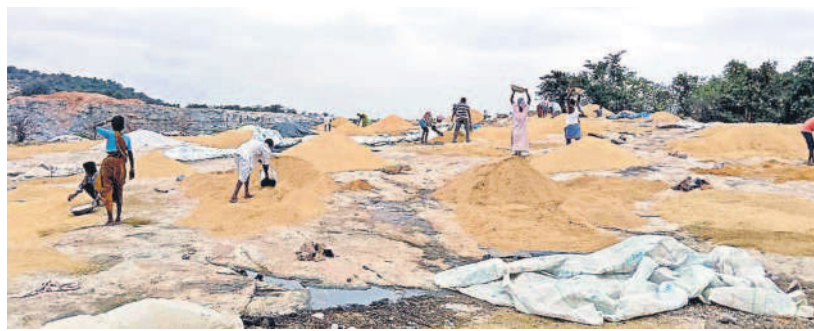
అర్రపల్లి మండలం బొంబలల్లి ఐకేపీ కేంద్రంలో ధాన్యం ఆరణ్యోన్నత రైతులు

సూర్యాపేట, డిసెంబర్ 10 (నమస్తే తెలంగాణ) : చెరువులు బాగుపడడం.. సరిహద్దు వద్దాలు కరువుపడం.. నాగార్జునసాగర్, మూసీ, కాళేశ్వరం నుంచి గోదావరి జలాలు రావడంతో సూర్యాపేట జిల్లాలో వరి సాగు గణనీయంగా పెరిగింది. దాంతో రాష్ట్రంలో రికార్డు స్థాయిలో పంట పండింది. ఫలితంగా వరుసగా ఆరేండ్ల మాదిరిగా ఈ వానకాలంలో కూడా రైతులకు జీలు బాగా కలిగింది. గలగలలాడుతున్నాయి. జిల్లాలోని 2.49లక్షల మంది వరి సాగు చేసిన రైతుల చేతికి ఈ ఒక్క సీజన్లోనే 2,761 కోట్ల రూపాయలు అందాయి. జిల్లా వ్యాప్తంగా 4,31,730 ఎకరాల్లో వరి సాగు చేయగా రూ.2,546 కోట్ల విలువ చేసి 10,58,290 మెట్రిక్ టన్నుల పంట పండింది. సీజన్లకు ముందే పంట పెట్టుబడి సాయం కింద జిల్లా రైతుల ఆకౌంట్లలో టీఆర్ఎస్ ప్రభుత్వం రూ.215 కోట్లు జమ చేసింది. ఆరుగలం కట్టిన రైతులకు ఉమ్మడి రాష్ట్రంలో అన్ని రంగాల్లో నష్టపోవడం పరిహారంగా ఉండేది. తెలంగాణ