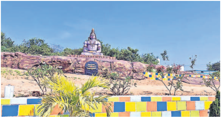
వైకుంఠరామంలో యోగముద్రలో ఉన్న శివుని విగ్రహం

దిన కర్మ ముగిసే వరకు అన్ని కార్యక్రమాలను అక్కడే నిర్వహించుకునేలా పనులు కల్పించారు. సాత ఇల్లు లేనివారు, ఏ ఆధారం లేనివారు.. అవసరమైతే అక్కడే ఉండి కార్యక్రమాలన్నీ పూర్తి చేసుకునేలా సౌకర్యాలు కల్పించారు. చిట్టాలలోని పాత శివనేనిగూడెం రోడ్డులో గల పాత శ్మశానవాటిక సమీపంలో నిర్మించిన ఈ వైకుంఠ రామానికి వెళ్లగానే పార్కుకు వెళ్లిన అనుభూతి కలుగుతుంది. అక్కడ ఓ పక్కనే మున్సిపల్ లింగయ్య, మున్సిపల్ మొక్కలకు సీళ్లు పోయడంతోపాటు వైకుంఠ రామాన్ని పరిశ్రమగా ఉంచుతున్నారు. గేటు దాటి లోపలికి వెళ్లగానే ముందుగా యోగముద్రలో