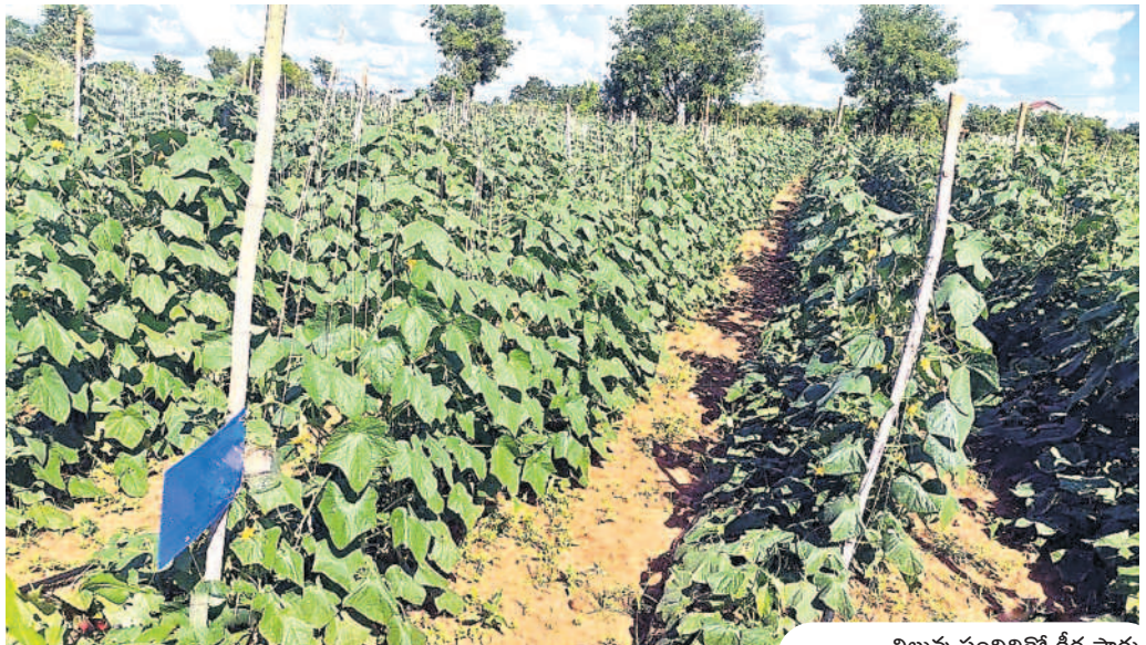
నిలువు పందిరితో కీర సాగు