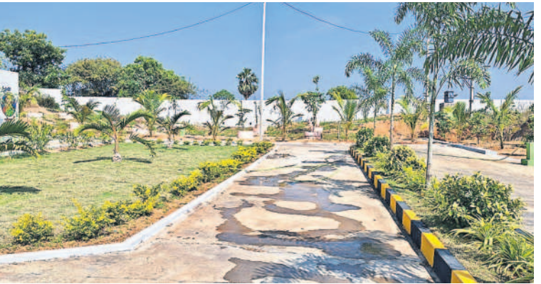
పార్కును తలపిస్తున్న వైకుంఠరామం