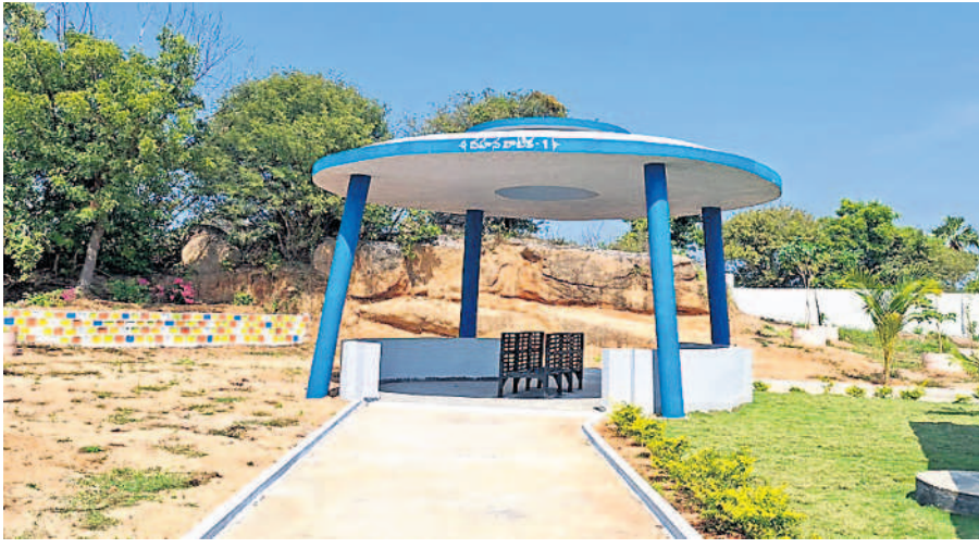
చిట్టాలలో నిర్మించిన వైకుంఠరామంలోని దహనవాటిక

చిట్టాల, డిసెంబర్ 10 : చివరి మజిలీకి ఎలాంటి అవాంతరాలు లేకుండా చిట్టాలలో ఆధునిక వైకుంఠ రామాన్ని నిర్మించారు. తమ సంబంధకుల అతిమయాశ్రమ సమయంలో అవసరమైతే అక్కడే ఉండి కార్యక్రమాలన్నీ పూర్తి చేసుకునేలా సౌకర్యాలు కల్పించారు. చిట్టాలలోని పాత శివనేనిగూడెం రోడ్డులో గల పాత శ్మశానవాటిక సమీపంలో నిర్మించిన ఈ వైకుంఠ రామానికి వెళ్లగానే పార్కుకు వెళ్లిన అనుభూతి కలుగుతుంది. అక్కడ ఓ పక్కనే మున్సిపల్ లింగయ్య, మున్సిపల్ మొక్కలకు సీళ్లు పోయడంతోపాటు వైకుంఠ రామాన్ని పరిశ్రమగా ఉంచుతున్నారు. గేటు దాటి లోపలికి వెళ్లగానే ముందుగా యోగముద్రలో