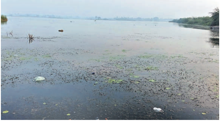
జలకళితో ఉద్బవించుతున్న కుక్కడం చెరువు

మాధ్యలపల్లి, డిసెంబర్ 10 : సీమాంధ్రుల పాలనలో చెరువులు నిరాధారణకు గురై అదృష్టంగా తయారయ్యాయి. స్వరాష్ట్రంలో టీఆర్ఎస్ ప్రభుత్వం కొలుపుదీసిన తరువాత కేసీఆర్ సారథ్యంలో మిషన్ భగీరథ ద్వారా చెరువుల పూడికతీత చేపట్టారు. దీంతో కాకతీయాల కాలం నాటి చెరువులు పునరుద్ధరణకు నోచుకొని నీటితో కళకళలాడుతున్నాయి. ఈ క్రమంలో మాధ్యలపల్లి మండలంలోని కుక్కడం చెరువులో ఎనిమిదేండ్ల తీతం పూడికతీత పనులు చేపట్టగా.. అప్పటి నుంచి నిండుకుండం తలపిస్తున్నది. వర్షాభావ పరిస్థితులు లెక్కానైతే నీటితో కళకళలాడుతున్న రైతులు, మత్స్య కారులకు జీవనాధారం అవుతున్నది. చెరువు నిండుకుండం అయితే రైతులు పుష్కలంగా పంటలు పండించుకొని హాయిగా బతుకుతున్నారు. టీఆర్ఎస్ ప్రభుత్వం చెరువులో ఉచితంగా చేప పిల్లలను