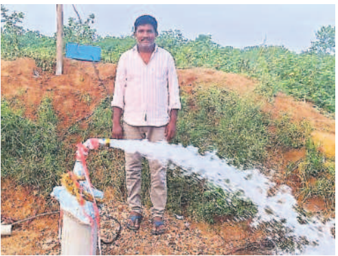
రైతు పొలంలో మూడించుల పోస్తున్న బోరు