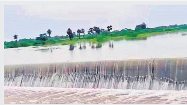
పులిమామిడి వద్ద నిర్మించిన చెక్ డ్యామ్ లో పుష్కలంగా ఉన్న నీళ్లు