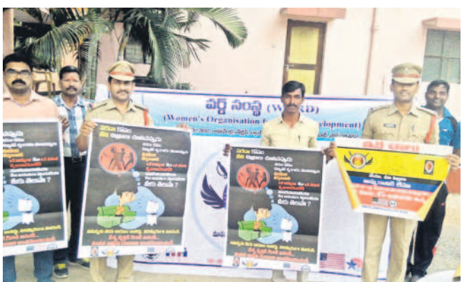
మానవ లక్ష్య రవాణా పోస్టును ఆవిష్కరిస్తున్న పోలీసు అధికారులు(ఫైల్)