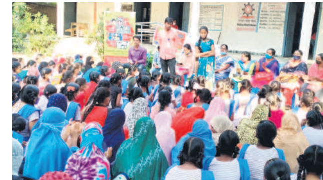
ఎలారెడ్డి ప్రభుత్వ బాలికల పాఠశాలలో బాల్య వివాహాలు, పోక్సో చట్టంపై విద్యార్థులకు అవగాహన