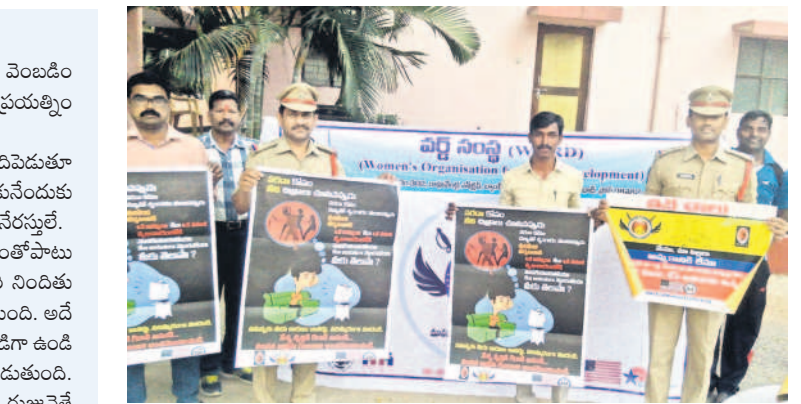
మానవ లక్ష్య రవాణా సౌకర్యాలను అభివృద్ధిపర్చు, పోలీసు అధికారులు (ఫైల్)