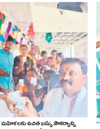
పిట్లంలో మహిళలకు ఉచిత బస్సు సౌకర్యాన్ని ప్రారంభిస్తున్న ఎమ్మెల్యే లక్ష్మీకాంతారావు