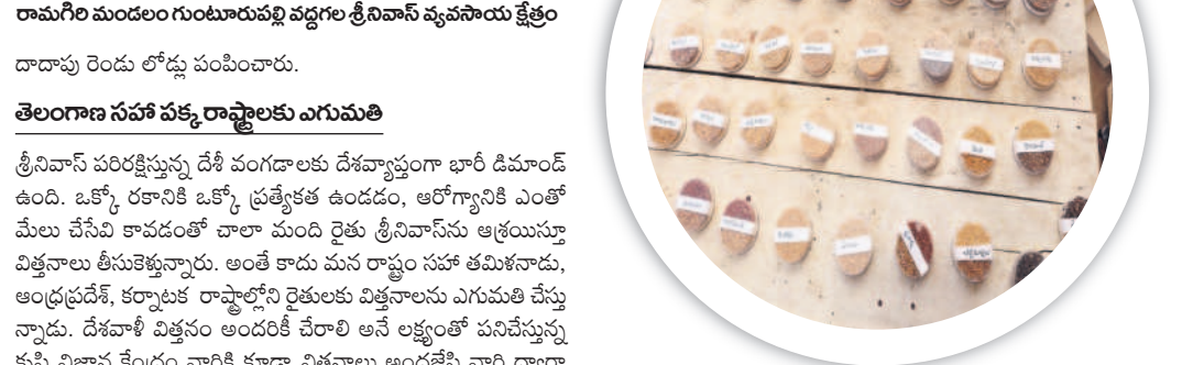
రామగిరి మండలం గుంటూరుపల్లి వద్ద గల శ్రీనివాస్ వ్యవసాయ క్షేత్రం