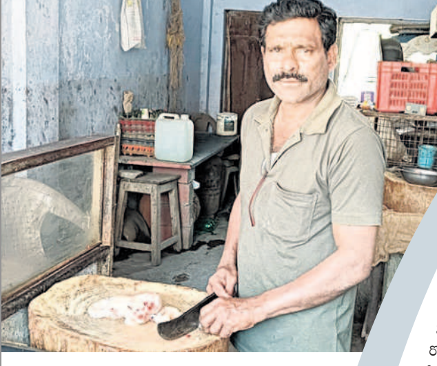
పరోక్ష నష్టాలు అధికమే..

కోళ్ల ధరలు పడిపోవడంతో ప్రభుత్వం రైతులపైనే కాకుండా పరోక్షంగా కూడా పలువురిపై ప్రభావం చూపుతోంది. ముఖ్యంగా కోళ్లను రవాణా చేసే వారిపై చికెన్ సెంటరుల నడుపుకునే వారిపైగా దీని ప్రభావం కనిపిస్తోంది. ప్రస్తుతం కార్మిక మాసం కావడంతో ఈ పరిస్థితి ఏర్పడిందనే భావన కనిపిస్తున్నా. గత కొంత కాలంగా నష్టాలు చవిచూస్తున్న బ్రాండుల రైతులు ఈ కారణాన్ని పూర్తిగా అంగీకరించడం లేదు. పెరుగుతున్న ఫీడ్ ధరలు, తగ్గుతున్న కోళ్ల ధరలు గత కొంత కాలంగా హెచ్చుతగ్గులకు గురవుతున్న పరిస్థితులు సాధించాడు. ప్రకృతి వ్యవసాయం చేస్తూ 2011 లో ఉమ్మడి కరింసగర్ జిల్లా స్థాయి ఉత్పత్తి పరి రైతుగా, సేంద్రీయ రైతుగా ఎంపికయ్యాడు. అది ఏడాది వ్యవసాయ శాఖలో వ్యవసాయ విస్తరణ అధికారి(ఏఈఓ)గా ఉద్యోగం వచ్చింది. అటు ఉద్యోగం చేస్తూ ఇంటి దగ్గర సుతహాగా సేంద్రీయ, ప్రకృతి వ్యవసాయం చేయడం మొదలుపెట్టాడు. ఈ క్రమంలో అంతరించిపోతున్న దేశీయ, పురాతన పరి వంగడాలును మునగడలో ఉంచాలని సంకల్పించాడు.