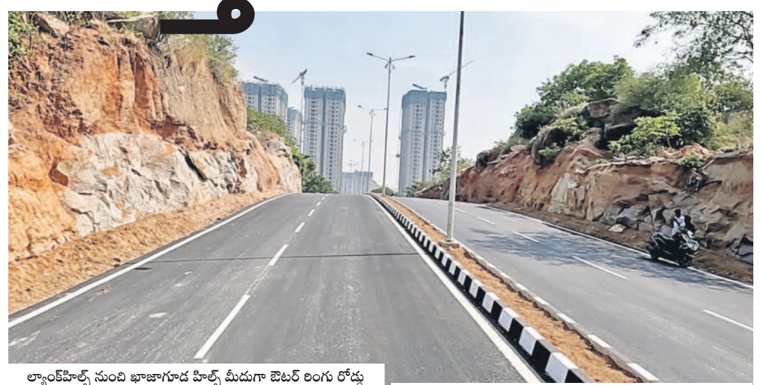
ల్యాండ్ హిల్స్ నుంచి ఖాజాగూడ హిల్స్ మీదుగా ఔటర్ రింగు రోడ్డు వరకు కొత్తగా నిర్మించిన లింకు రోడ్డు