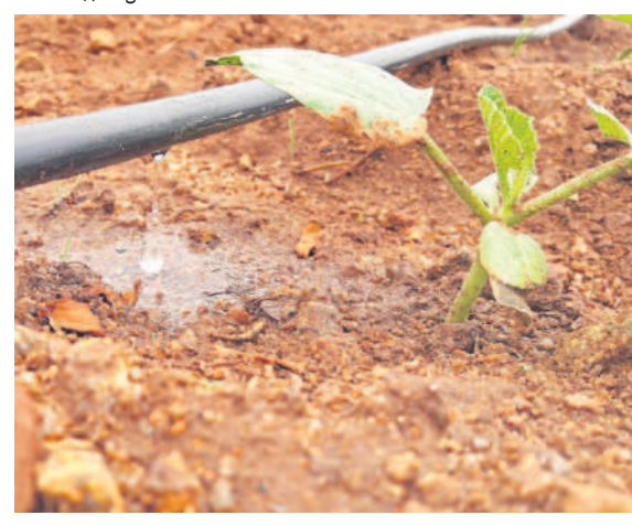
డ్రైవ్ విధానంలో మొక్క కాండం భాగంలో చుక్క చుక్కగా అందుతున్న నీరు

స్ప్రింకల్లను మూడు విధాలుగా పంట పొలాల్లో అమర్చుకోవచ్చు. శాశ్వతంగా పైపులను భూమిలో పాతిపెట్టి స్ప్రింకల్ల హెడ్లను అమర్చి నీటిని విరజిమ్ముడం మొదటి విధానం.. కొన్ని పైపులు భూమిలోపల ఉంచి మిగతా పరికరాలను బయట ఉంచి మొక్కలన్నింటికీ తుంపర్ల పడేలా అమర్చుకోవడం రెండో పద్ధతి.. ఇక స్ప్రింకల్ల పైపులన్నీ భూమిపైనే ఉంచి పంటకు నీరందించడం మూడో విధానంగా చెప్పొచ్చు. ఇందులో పైపులను ఒక్కోచోట నుంచి మరో చోటుకు తరలించి అన్ని పంటలకు తుంపర సేద్యం ద్వారా నీటిని అందించేందుకు వీలవుతుంది. స్ప్రింకల్లలో ముఖ్యమైనది స్ప్రింకల్ల హెడ్, ఇందులో రెండు రంధ్రాలుంటాయి. ఒకటి 4 నుంచి 5.6మి.మీల సైజు ఉండగా, ఇంకోటి 3.13 మి.మీల సైజు ఉంటుంది. ఎక్కువ వీడనం గల స్ప్రింకల్ల సుమారు 95 మీటర్ల వ్యాసం కలిగిన భూమిని తడుపుతుంది. తక్కువ వీడనం గల స్ప్రింకల్ల 30మీటర్ల వ్యాసం గల భూమిని మాత్రమే తడుపుతుంది.