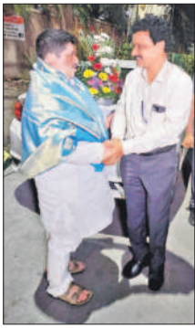
-హుస్సాబాద్ టౌన్, డిసెంబర్ 10