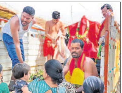
చేర్యాల పట్టణంలో అమ్మవారి విగ్రహాన్ని ఊరేగిస్తున్న కమిటీ సభ్యులు

చేర్యాల, డిసెంబర్ 10 : పట్టణంలో నూతనంగా నిర్మించిన కనక దుర్గా ఆలయంలో అమ్మవారి విగ్రహాన్ని ప్రతిష్ఠించేందుకు శ్రీ దుర్గామాత దేవాలయ నిర్మాణ కమిటీ ఘనంగా ఏర్పాట్లు చేస్తున్నది. దుర్గామాత ప్రతిష్ఠ మహోత్సవాలు ఈ నెల 14 నుంచి 17వ తేదీ వరకు నిర్వహించనున్నారు. ఉత్సవాల్లో భాగంగా ఆదివారం పట్టణంలో అమ్మవారి విగ్రహాన్ని శోభాయాత్ర చేపట్టడంతో మహిళలు పెద్ద ఎత్తున తరలివచ్చి జలాభిషేకం చేశారు.