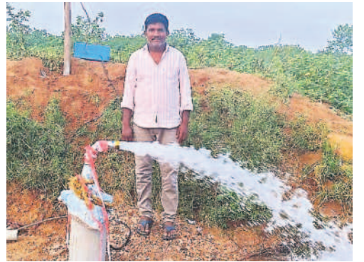
రైతు పొలంలో మూడించుల పోస్తున్న బోరు