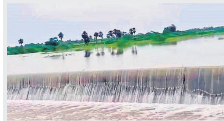
పులిమామిడి వద్ద నిర్మించిన చెక్ డ్యామ్ లో పుష్కలంగా ఉన్న నీళ్లు