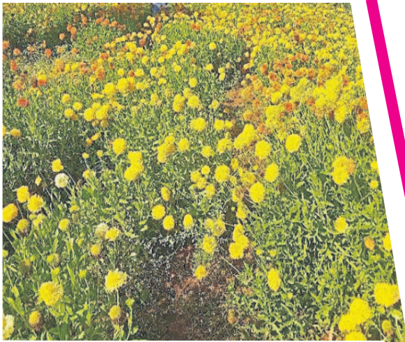
ఇప్పాయిపల్లి గ్రామంలో సాగు చేసిన పూల తోట