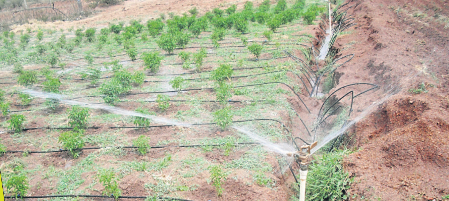
పంటకు తుంపర సేద్యం విధానంలో అందుతున్న నీరు