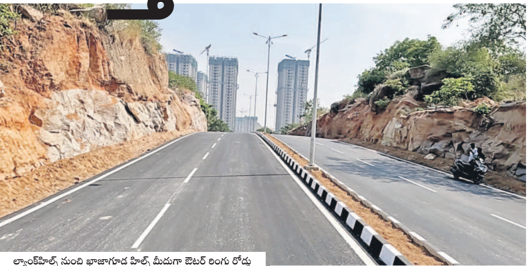
ల్యాండ్ హిల్స్ నుంచి ఖాజాగూడ హిల్స్ మీదుగా ఔటర్ రింగు రోడ్డు వరకు కొత్తగా నిర్మించిన లింకు రోడ్డు