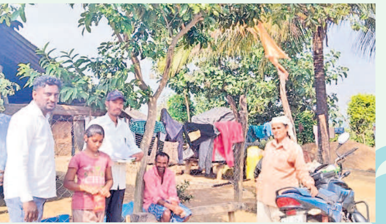
బయ్యారం మండలం చింతలతండాలో సర్వే చేస్తున్న సీఆర్టీ కన్వయర్