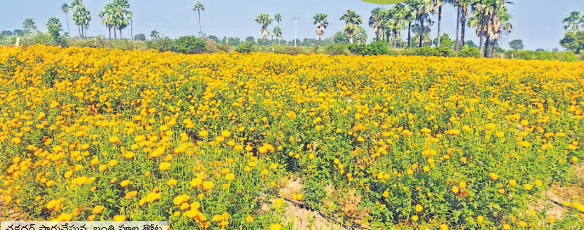
చక్కెర సాగుచేస్తున్న బంతి పూల తోట