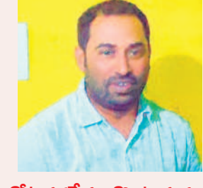
తోట వద్దకే వచ్చి కొంటున్నరు..