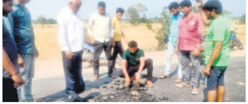
నాసిరకంగా నిర్మించారని తారురోడ్డును చూపిస్తున్న గ్రామస్థులు