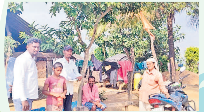
బయ్యారం మండలం చింతలతండాలో సర్వే చేస్తున్న సీఆర్ టీ కన్వయర్