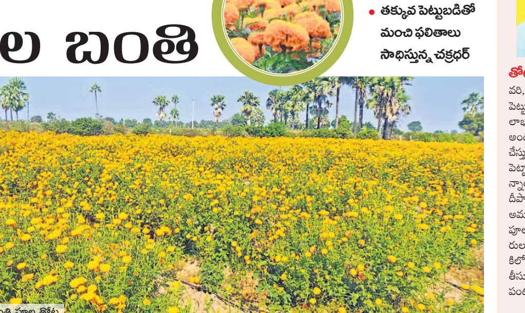
చక్రధర్ సాగుచేస్తున్న బంతి పూల తోట