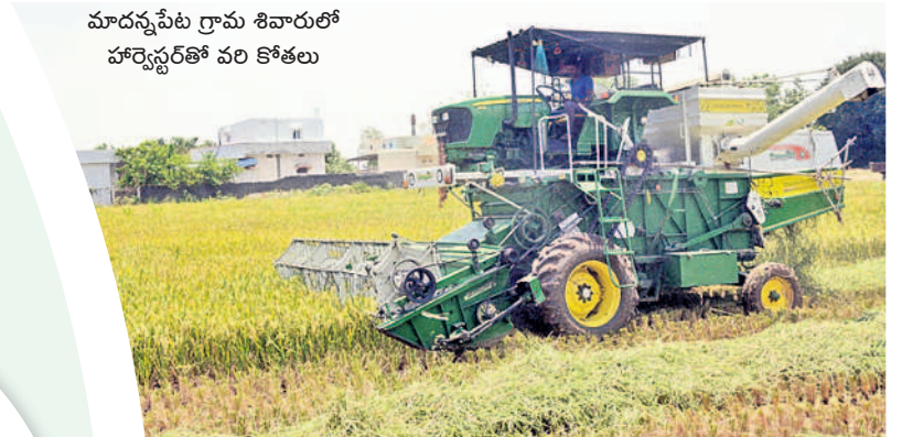
మాదన్నపేట గ్రామ శివారులో హార్వెస్టర్ తో వరి కోతలు