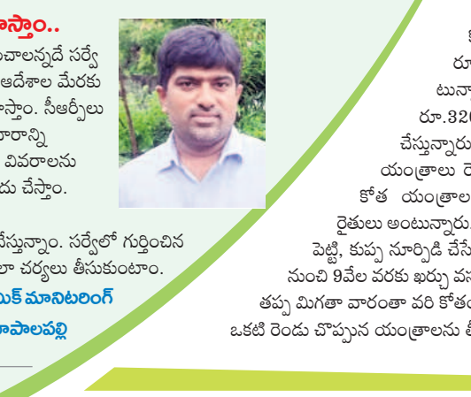
- కె.లక్ష్మణ్, జిల్లా అధికారి మానిలలింగం

అందరికీ విద్య అందించాలన్నదే సర్వే లక్ష్యం. ఉన్నతాధికారుల ఆదేశాల మేరకు పక్కడంటేగా సర్వే నిర్వహిస్తాం. సీఆర్ టీలు క్షేత్రస్థాయిలో వెళ్లి సమాచారాన్ని సేకరిస్తారు. బడిబయట పిల్లలను గుర్తించి తక్షణమే సంబంధిత గ్రామ పాఠశాల హెచ్.ఎం.తో ప్రభుత్వ పాఠశాలలో చేర్పించాలి. బడిబయట పిల్లలను గుర్తించి తక్షణమే సంబంధిత గ్రామ పాఠశాల హెచ్.ఎం.తో ప్రభుత్వ పాఠశాలలో చేర్పించాలి. బడిబయట పిల్లలను గుర్తించి తక్షణమే సంబంధిత గ్రామ పాఠశాల హెచ్.ఎం.తో ప్రభుత్వ పాఠశాలలో చేర్పించాలి. బడిబయట పిల్లలను గుర్తించి తక్షణమే సంబంధిత గ్రామ పాఠశాల హెచ్.ఎం.తో ప్రభుత్వ పాఠశాలలో చేర్పించాలి.