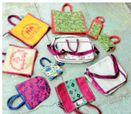
సెర్స్ ఆధ్వర్యంలో మహిళలు తయారు చేసిన జాట్ బ్యాగులు