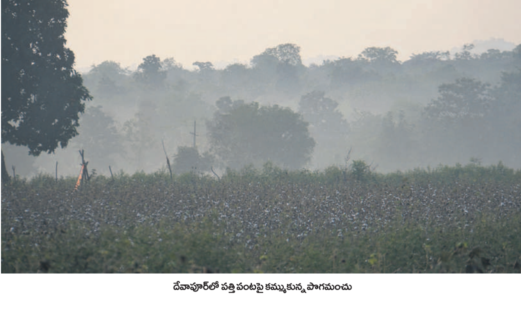
దేవాపూర్ లో పత్తి పంటపై కమ్మకున్న పాగమంచు