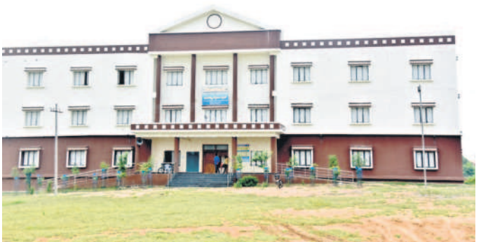
ఆదిలాబాద్ లోని మహాత్మా జ్యోతి బా పూలే విద్యాలయం