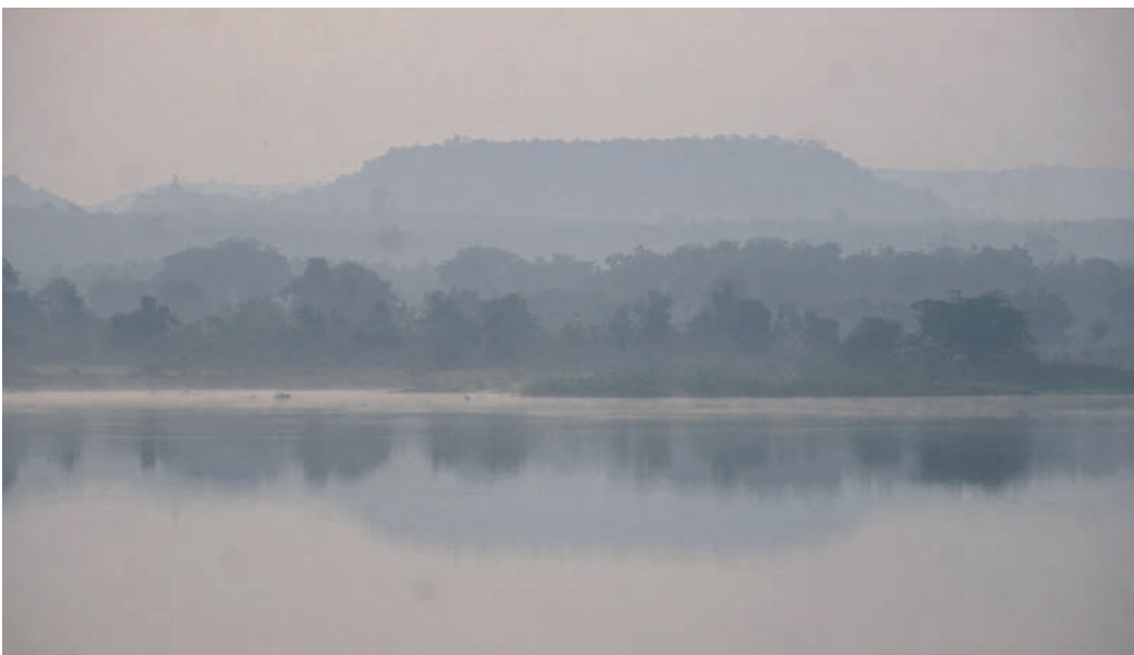
మావల కొండపై కమ్మకున్న పాగమంచు