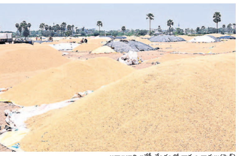
అర్బాలబావి ఇకేపీ కేంద్రంలో ధాన్యం రాతులు (ఫైల్)