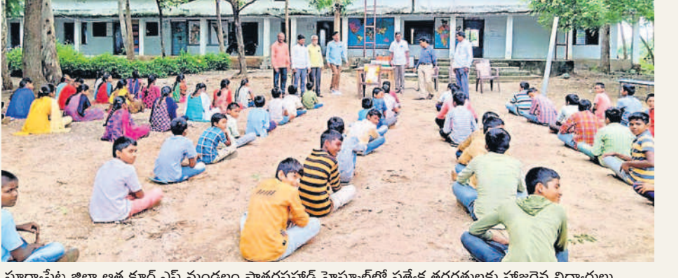
సూర్యాపేట జిల్లా అత్మకూర్.ఎస్ మండలం పాతద్దపహడ్ హైస్కూల్లో ప్రత్యేక తరగతులకు హాజరైన విద్యార్థులు

నిలాఖరులోగా సిలబస్ పూర్తి చేసేలా కార్యాచరణ ప్రతిరోజూ స్పెషల్ క్లాసులు.. చదువులో వెనుకబడిన విద్యార్థులపై ప్రత్యేక శ్రద్ధ