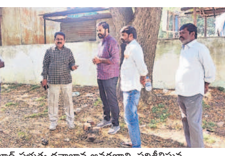
షాబాద్ ప్రభుత్వ దవాఖాన ఆవరణాన్ని పరిశీలిస్తున్న జిల్లా ఉప వైద్యాధికారి