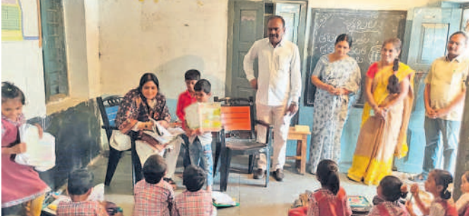
చిల్డ్రన్ మైలారం యూపీఎస్ లో విద్యార్థులతో మాట్లాడుతున్న డీకావో