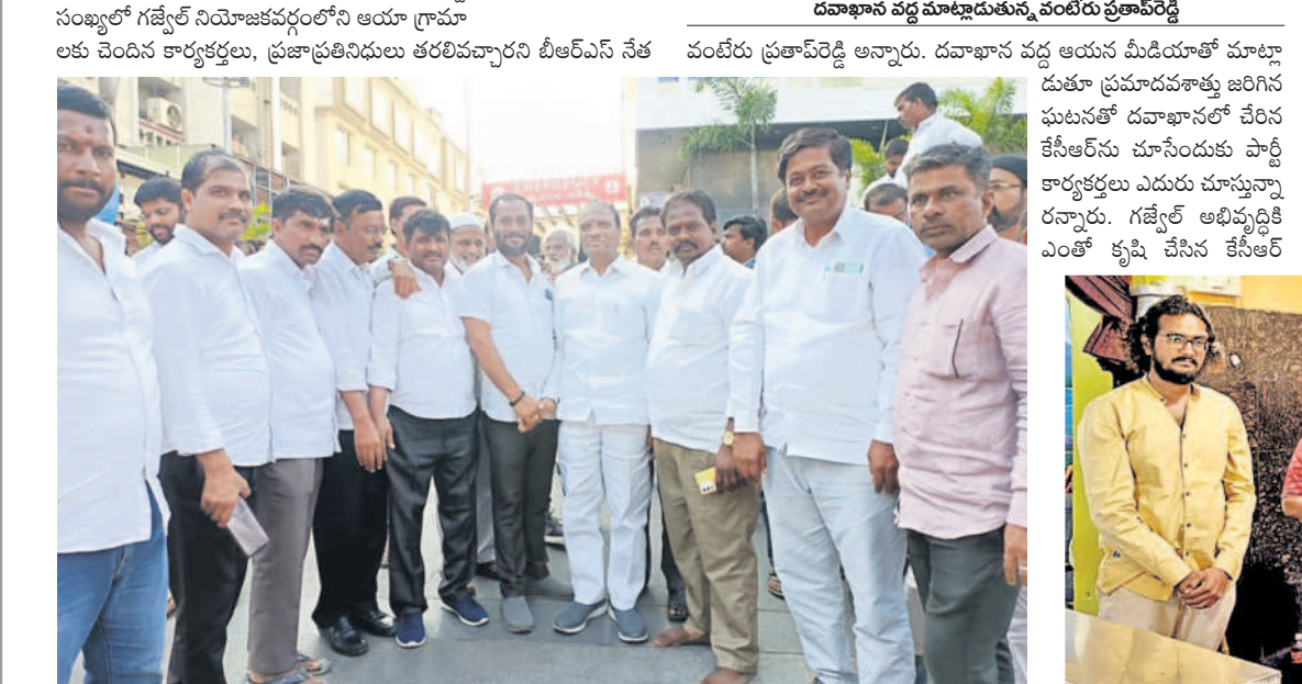
యశోద దవాఖానకు ఆరలివెళ్లిన మున్సిపల్ చైర్మన్ రాజమౌళి, కౌన్సిలర్లు, నాయకులు

గజ్వేల్/ గజ్వేల్ అర్బన్, డిసెంబర్ 12: హైదరాబాద్ లోని యశోద దవాఖానలో చికిత్స పొందుతున్న మాజీ ముఖ్యమంత్రి, గజ్వేల్ ఎమ్మెల్యే కేసీఆర్ ను చూసేందుకు మంగళవారం గజ్వేల్ నియోజకవర్గంలోని ప్రజాప్రతినిధులు, పార్టీ శ్రేణులు వెళ్లడం తరలివెళ్లారు. కొంతకాలం కేసీఆర్ దవాఖానలోనే విశ్రాంతి తీసుకోవాలని వైద్యులు సూచించడంతో ఆయనను కార్యకర్తలు కలువలేకపోయారు. దవాఖాన వద్ద వెళ్లడం తరలివెళ్లిన మేరకు ఉన్న కార్యకర్తలను మాజీ మంత్రి కేసీఆర్ కలిసి విషయం చెప్పడంతో అందరూ వెనుతిరిగి వచ్చారు. కేసీఆర్ త్వరగా కోలుకోవాలి: వంటలు ప్రణాళి రెడ్డి బీఆర్ఎస్ అధినేత, మాజీ సీఎం కేసీఆర్ త్వరగా కోలుకోవాలని, ఆయనను చూసేందుకు వెళ్లడం సందర్భంగా గజ్వేల్ నియోజకవర్గంలోని ఆయా గ్రామాలకు చెందిన కార్యకర్తలు, ప్రజాప్రతినిధులు తరలివచ్చారని బీఆర్ఎస్ నేత వంటేరు ప్రశాంత్ రెడ్డి అన్నారు. దవాఖాన వద్ద ఆయన మీడియాతో మాట్లాడుతూ ప్రమాదవశాత్తు జరిగిన ఘటనతో దవాఖానలో చేరిన కేసీఆర్ ను చూసేందుకు పార్టీ కార్యకర్తలు ఎదురు చూస్తున్నారన్నారు. గజ్వేల్ అభివృద్ధికి ఎంతో కృషి చేసిన కేసీఆర్