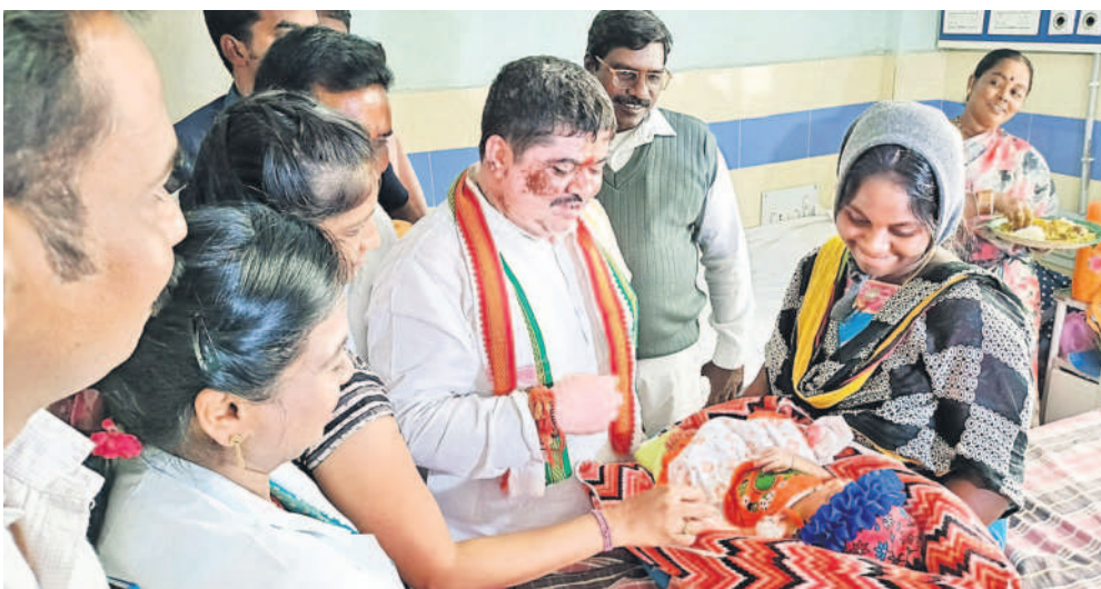
హుస్సాబాద్ సర్కారు దవాఖానలో రెండు రోజుల క్రితం జన్మించిన శిశువును చూస్తున్న మంత్రి పాస్కం ప్రభాకర్