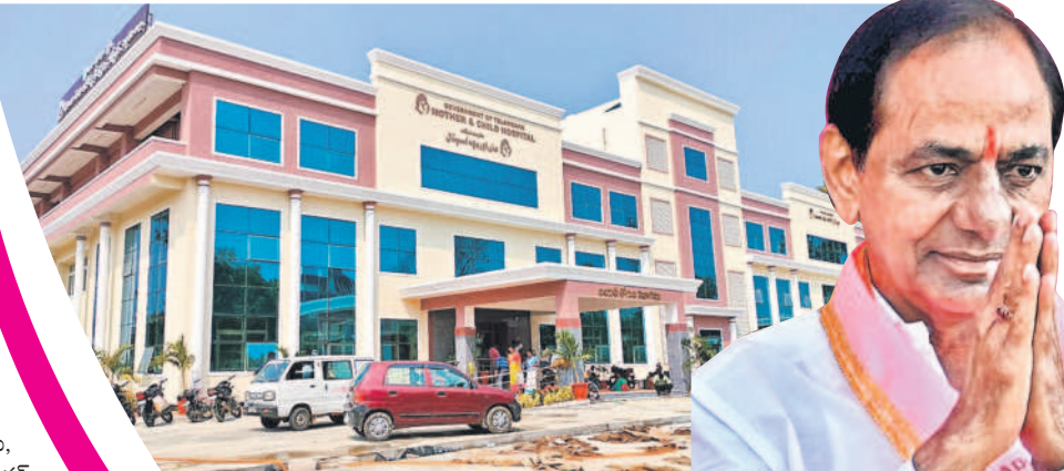
గజ్వేల్లో మాతాశిశు దవాఖాన

గజ్వేల్, డిసెంబర్ 12 : ప్రత్యేక తెలంగాణ రాష్ట్ర సాధనలో వెన్నంటి నడిసిన గజ్వేల్ నియోజకవర్గ ప్రజలు రాష్ట్రం సాధించుకున్న తర్వాత కూడా ఉద్యమపాత్రతోనే ఉన్నారు. తెలంగాణ ఉద్యమ సమయంలో అన్ని వర్గాల రాష్ట్రసాధనలో కీలకంగా పాటుపడుతున్నారు. రాజకీయ పార్టీలను వైతన్యం చేయడంలో గజ్వేల్ గడ్డ ఎంతో ముందుంటుంది. రాష్ట్ర సాధన తర్వాత కేసీఆర్ గజ్వేల్ ప్రాంతంలోనే స్థిర నివాసం ఏర్పాటు చేసుకోవడంతో ప్రజలు మరింత దగ్గరయ్యారు. రాష్ట్ర సాధన తర్వాత కేసీఆర్ ఎర్రపల్లి వ్యవసాయక్షేత్రం నుంచి 2014లో మొదటి సారి ఎన్నికల్లో పాల్గొనేందుకు కార్యవరణ రూపొందించారు. గజ్వేల్ ప్రాంతం అన్నింటికీ ముందు పరుసలోనే ఉంది. 2014, 2018లో రెండు సార్లు ముఖ్యమంత్రిని అందించిన ఘనత గజ్వేల్ ప్రజలకు దక్కుతుంది. చరుసగా మూడుసార్లు గజ్వేల్ నుంచి గెలుపొంది కేసీఆర్ హక్కులేక సాధించారు.