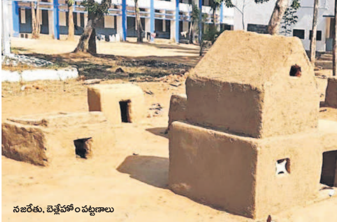
నబేతు, వెళ్లవోం పట్టణాలు