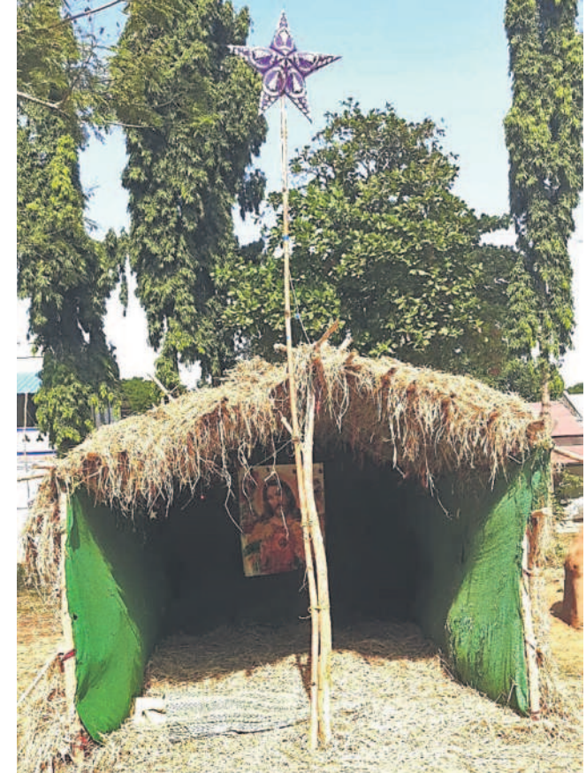
చర్ల ఆవరణలోని వసతి గృహం వద్ద ఓసర్లకు జన్మ వృత్తాంతాన్ని తెలిపే పశువుల పాక

బాల్లూర్, బాలికల కోసం వేరు వేరుగా రూ.146 కోట్లతో ఎదురేపిన హాట్ నిర్మించి నశల వనతులు కల్పించారు. గజ్వేల్ పట్టణం చుట్టూ 22కిలోమీటర్ల మేర రూ.297 కోట్లతో రింగ్రోడ్డు నిర్మాణం, రూ.719.50 కోట్లతో 354కిలోమీటర్ల ఆర్ అండ్ బీ రోడ్ల నిర్మాణం లతో పాటు పంచాయతీ రాష్ట్ర, గజ్వేల్ మండలం కోమటిబండ వద్ద తెలంగాణ రాష్ట్రానికి తలమానికంగా రూ.400 కోట్లతో మిషన్ భగీరథ ప్లాంట్, కుకునూర్ పల్లి మండలం మంగోల్ వద్ద రూ.1212 కోట్లతో