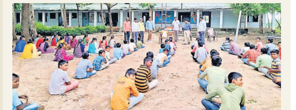
సూర్యాపేట జిల్లా ఆత్మకూర్.ఎస్ మండలం పాతద్రవహద్ హైస్కూల్లో ప్రత్యేక తరగతులకు హాజరైన విద్యార్థులు

టిన్లో వంద శాతం ఫలితాలే లక్ష్యంగా విద్యార్థులకు కనరత్తు నెలాఖరులోగా సిలబస్ పూర్తి చేసేలా కార్యాచరణ ప్రతిరోజూ సిస్టర్ల క్లాసులు.. చదువులో వెనుకబడిన విద్యార్థులపై ప్రత్యేక శ్రద్ధ