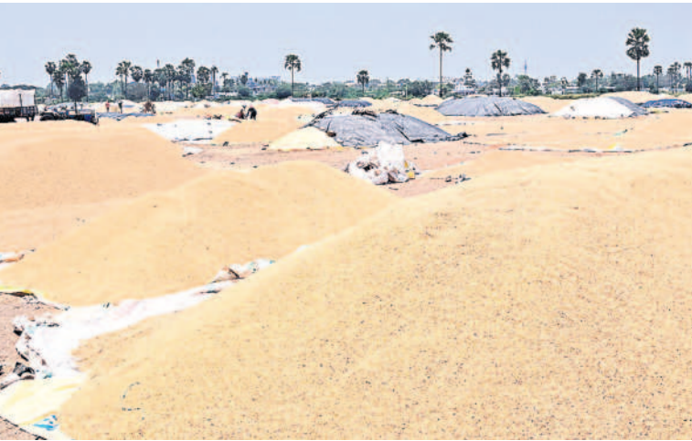
అర్బులబావి ఇకేపీ కేంద్రంలో ధాన్యం రాతులు(ఫైల్)