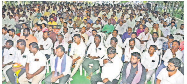
సమావేశానికి హాజరైన నాయకులు, కార్యకర్తలు

బొడ్రాయిబజార్, డిసెంబర్ 12 : హామీలను నెరవేర్చిన ఘనత కాంగ్రెస్ పార్టీ చరిత్రలోనే లేదని రాష్ట్ర విద్యుత్ శాఖ మాజీ మంత్రి, సూర్యాపేట ఎమ్మెల్యే గుంటకండ్ల జగదీశ్ రెడ్డి అన్నారు. మంగళవారం సూర్యాపేట జిల్లా కేంద్రంలోని సుమం గిజి ఫంక్షన్ హాల్లో ఏర్పాటు చేసిన బీఆర్ఎస్ ముఖ్య కార్యకర్తల సమావేశంలో ఆయన మాట్లాడారు. అధికారం ఉన్నా లేకున్నా ఎప్పుడూ ఒకేలా ఉంటూ ప్రజల సమస్యలను పరిష్కరించేందుకు ముందుంటామని తెలిపారు. ప్రజలు మనకు ప్రతిపక్ష బాధ్యతను ఇచ్చారని వారి ఆలోచనలతో నిర్ణయాలు తీసుకుని ముందుకు సాగుదామని చెప్పారు. ప్రజలు ప్రభుత్వంపై ప్రశ్నలు లేవనెత్తే వరకు ఓపికతో ఉందామని సూచించారు. కాంగ్రెస్ ఇచ్చిన హామీలు అమలయ్యేంత వరకు ప్రజల పక్షాన నిలిచి పోరాడుదామని తెలిపారు. ప్రజలు బీఆర్ఎస్ కు పదేండ్లు అధికారం ఇస్తే ఎన్నో మంచి పనులు చేసినట్లు వెల్లడించారు. ప్రజలకు ఇచ్చిన హామీలు నెరవేర్చాలంటే దమ్ము ధైర్యం ఉండాలని కాంగ్రెస్ 90 రోజులు కాదు కదా 900 రోజులైనా నేరవేర్చడం వచ్చింది. జోగు లాంబ నుంచి అలంపూర్ వరకు బీఆర్ఎస్ అభ్యర్థులందరూ ఓటమి పాలైనా సూర్యాపేటలో తాను గెలిచి బొడ్రాయిలాగా నిలిచానని మళ్లీ ఎన్నికల వరకు ఒక్కటి లేకుండా అన్ని మనమే గెలుస్తామని అందులో ఎలాంటి సందేహం లేదని భరోసానిచ్చారు. మంచి కోసం నిలబడి త్యాగాలకు సిద్ధప