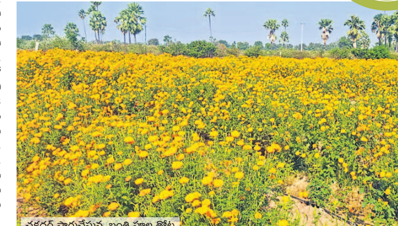
చక్కెర సాగుచేస్తున్న బంతి పూల తోట