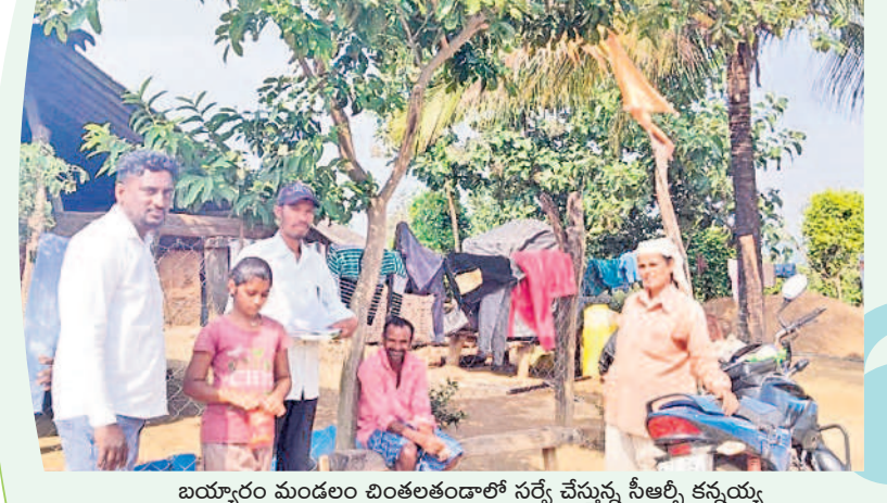
బయ్యారం మండలం చింతలతండాలో సర్వే చేస్తున్న సీఆర్ కేలు