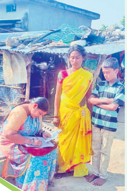
నెల్లికూరు మండలం వరంబండ తండాలో సర్వే చేస్తున్న సీఆర్ కేలు