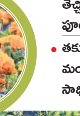
చక్కెర సాగుచేస్తున్న బంతి పూల తోట