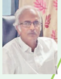
రూమాంబ, డి.కె.వో, మహబూబాబాద్