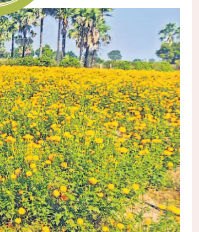
చక్కెర సాగుచేస్తున్న బంతి పూల తోట