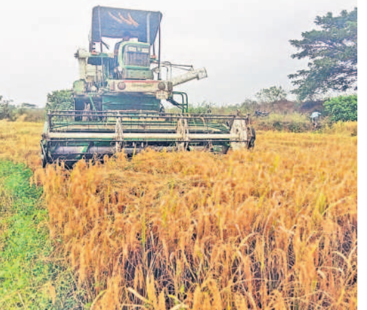
ఇప్పటికే దింపారు. ఎకరం వరి కోసినందుకు హార్వెస్టర్ యజమానులు రూ.2వేల నుంచి రూ.2200 తీసుకుంటున్నారు. చైన్ మిషన్‌కు మాత్రం రూ.3200ల నుంచి రూ.3600 వరకు వచ్చి చేస్తున్నారు. ఒక ఎకరం వరిని వరికోత యంత్రాలు రెండు గంటల్లోపు కోస్తున్నాయి. వరి కోత యంత్రాల విధానమే బాగుండని పలువురు రైతులు అంటున్నారు. కూలీల సహాయంతో కోతకోసి, కచ్చు పెట్టి, కచ్చు నూర్చిడి చేసి సరికి సుమారు ఎకరానికి రూ.8వేల నుంచి 9వేల వరకు ఖర్చు వస్తుందంటున్నారు. యంత్రాల సహాయంతో కోస్తే వరిగడ్డి అక్కిరకు రాకుండా పోతుంది. గడ్డి అవసరమున్న రైతులు తప్ప మిగతా వారంతా వరి కోతయంత్రాలను ఎక్కువగా ఆశ్రయిస్తున్నారు. రైతుల అవసరాలను గమనించిన హార్వెస్టర్ల యజమానులు గ్రామానికి ఒకటి రెండు చొప్పున యంత్రాలను తీసుకువచ్చి సామర్థ్యవేసుకుంటున్నారు.

సర్వవేట రూరల్, డిసెంబర్ 12 : వ్యవసాయరంగంలో ప్రతీ సంవత్సరం చూడవలసిన మార్పులు వస్తున్నాయి. కూలీల కొరత కారణంగా రైతులు యంత్రాలపై ఎక్కువగా ఆధారపడుతున్నారు. ప్రస్తుత ఖరీఫ్ సీజన్‌లో ఒకేసారి వరి సాగు కోతకు రావడంతో కోత యంత్రాలకు గిరాకీ పెరిగింది. కూలీలకు బదులు యంత్రాలతో గంటల వ్యవధిలోనే పంట ఉత్పత్తులు చేతికి అందివ్వడంతో రైతులు ఈ యంత్రాల వైపు మొగ్గుచూపుతున్నారు. కంపెనీల కొంత అనుభవమైప్పటికీ సమర్థిగా వర్షాలు కురవడంతో బావులు, చెరువులు, కుంటల కింద ఒకేసారి రైతాంగం వరి సాగుకు చేశారు. దాదాపు వరి ఒకేసారి కోతకు రావడంతో యంత్రాలకు భలే గిరాకీ వచ్చింది. రాష్ట్రం నుంచి గాక ఆంధ్రప్రదేశ్, తమిళ నాడు నుంచి వరికోత యంత్రాలు భారీగా తరలివచ్చాయి. అన్ని గ్రామాల్లో హార్వెస్టర్ల యజమానులు యంత్రాలను ఇప్పటికే దింపారు. ఎకరం వరి కోసినందుకు హార్వెస్టర్ యజమానులు రూ.2వేల నుంచి రూ.2200 తీసుకుంటున్నారు. చైన్ మిషన్‌కు మాత్రం రూ.3200ల నుంచి రూ.3600 వరకు వచ్చి చేస్తున్నారు. ఒక ఎకరం వరిని వరికోత యంత్రాలు రెండు గంటల్లోపు కోస్తున్నాయి. వరి కోత యంత్రాల విధానమే బాగుండని పలువురు రైతులు అంటున్నారు. కూలీల సహాయంతో కోతకోసి, కచ్చు పెట్టి, కచ్చు నూర్చిడి చేసి సరికి సుమారు ఎకరానికి రూ.8వేల నుంచి 9వేల వరకు ఖర్చు వస్తుందంటున్నారు. యంత్రాల సహాయంతో కోస్తే వరిగడ్డి అక్కిరకు రాకుండా పోతుంది. గడ్డి అవసరమున్న రైతులు తప్ప మిగతా వారంతా వరి కోతయంత్రాలను ఎక్కువగా ఆశ్రయిస్తున్నారు. రైతుల అవసరాలను గమనించిన హార్వెస్టర్ల యజమానులు గ్రామానికి ఒకటి రెండు చొప్పున యంత్రాలను తీసుకువచ్చి సామర్థ్యవేసుకుంటున్నారు.