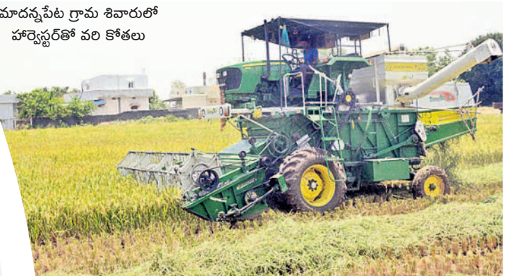
మాదన్నపేట గ్రామ శివారులో హార్వెస్టర్ తో వరి కోతలు