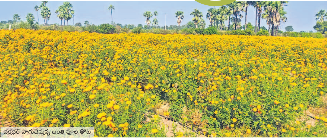
చక్రధర్ సాగుచేస్తున్న బంతి పూల తోట