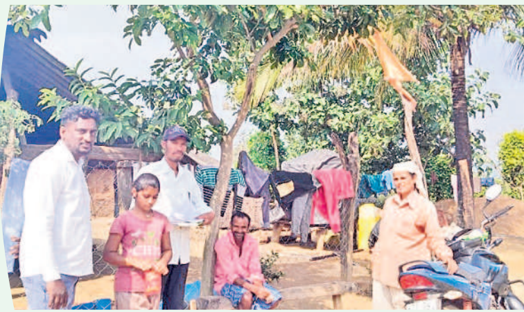
బయ్యారం మండలం చింతలతండాలో సర్వే చేస్తున్న సీఆర్‌యే కన్వయర్

బడి బయట పిల్లల గుర్తింపు, డ్రాబాక్స్ పిల్లల ప్రస్తుత స్థితిపై సీఆర్‌యేలు, ఇతర అధికారులు నిర్వహించే సర్వే ప్రతిరోజు అధికారులు పర్యవేక్షిస్తారు. కాంప్లెక్స్ పరిధిలో జరుగుతున్న సర్వేను కాంప్లెక్స్ ప్రధానాధికారులు, సంబంధిత గ్రామాల్లో జరుగుతున్న సర్వేను పాఠశాల హెచ్‌ఎం నిత్యం పర్యవేక్షించాలి. ఉంటుంది. మండలంలో మండల విద్యాశాఖ అధికారి ప్రతీ కాంప్లెక్స్ పరిధిలోని ఒక గ్రామంలో ఆరిగి సర్వేను పర్యవేక్షించి అప్పటివరకు సేకరించిన సమాచారంపై సమీక్ష నిర్వహించాలి.