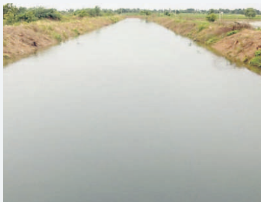
వరద కాల్వ (ఫైల్)

సమైక్య పాలనలో తలాపున కృష్ణమ్మ పరుగెడుతున్నా నల్లగొండ జిల్లాలో సాగు, తాగు నీటికి కరువు ఉండేది. పచ్చని ప్రదేశ కళకళలాడాల్సిన నేలలు నెలెలు బారేది. కార్గెన్ ప్రభుత్వ హయాంలో సాగునీటి ప్రాజెక్టుల నిర్మాణం, కాల్వల తవ్వకం దశాబ్దాలపాటు నత్తనడకన సాగడంతో జిల్లా ప్రజలు, ముఖ్యంగా నాగార్జునసాగర్ నియోజకవర్గ జనం తాగు, సాగునీటికి లిగిసిన పడ్డారు. 2014లో స్వరాష్ట్రం సిద్ధించాక ఉమ్మడి నేత కేసీఆర్ ముఖ్యమంత్రిగా బాధ్యతలు చేపట్టాక ఏఎమ్మార్సీ లోలివల్ కెనాల్, పంపిణీ సాగు నిర్మాణానికి సుమారు రూ.93 కోట్లు వెచ్చించి రెండేండ్లలోనే పూర్తి చేయించారు. దాంతో గత అరేండ్లుగా నాగార్జునసాగర్, నల్లగొండ, మిర్యాలగూడెం నియోజకవర్గాల్లోని ఏడు మండలాల్లో దాదాపు 80 వేల ఎకరాలు సాగునీరు అందుతుంది. దాంతో నేడు పనికి వంటలు పండుతుండడంతో రైతులు హర్షం వ్యక్తం చేస్తున్నారు. -హరియా, డిసెంబర్ 12