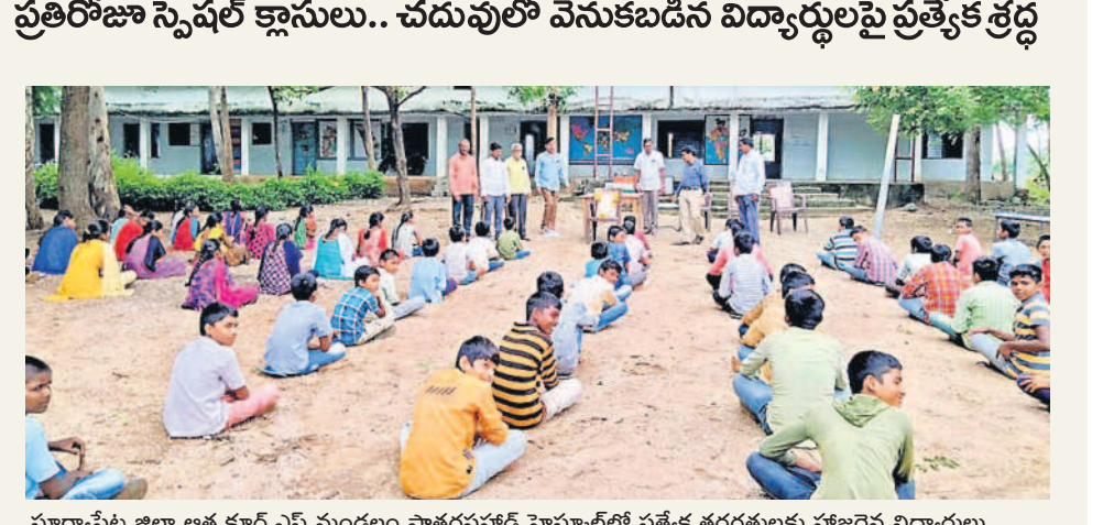
సూర్యాపేట జిల్లా ఆత్మకూర్.ఎస్ మండలం పాతద్రవహద్ హైస్కూల్లో ప్రత్యేక తరగతులకు హాజరైన విద్యార్థులు

నెలాఖరులోగా సిలబస్ పూర్తి చేసేలా కార్యాచరణ ప్రతిరోజూ స్పెషల్ క్లాసులు.. చదువులో వెనుకబడిన విద్యార్థులపై ప్రత్యేక శ్రద్ధ