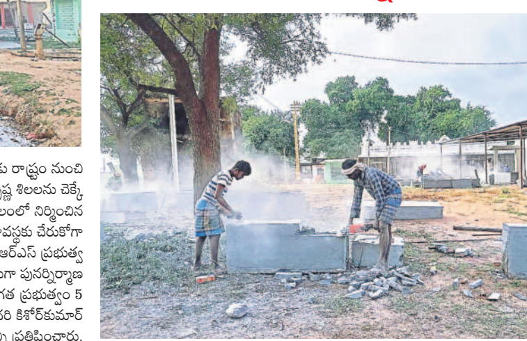
ఆలయ ప్రాంగణంలో వని చేస్తున్న శిల్పిలు