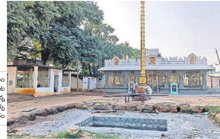
దేవాలయం ఎదురు నిర్మిస్తున్న తూర్పు రాజగోపురం

సత్తనడకన సాగిన ఏఎమ్మార్సీ లోలివల్ కెనాల్ పనులను త్వరితగతిన పూర్తి చేసిన ఘనత బీఆర్ఎస్ ప్రభుత్వానికే దక్కింది. 2014లో అధికారంలోకి వచ్చిన కేసీఆర్ ప్రభుత్వం నాగార్జున సాగర్ నియోజకవర్గంలోని టెయిలెండ్ భూములకు సాగునీరు అందించాలనే సంకల్పంతో పంపిణీ నిర్మాణాన్ని వేగవంతం చేసింది. దివంగతకే ఎమ్మెల్యే నోముల నర్సింహయ్య పట్టుదల, నాటి భారీ నీటిపారుదల శాఖ మంత్రి హరిశ్చంద్రాపు ప్రత్యేక చొరవ, ముఖ్యమంత్రి కేసీఆర్ సహకారంతో నూతన ధరల ప్రకారం పంపిణీని నిర్మాణ వ్యయాన్ని రూ.148 కోట్లకు పెంచడంతోపాటు సకాలంలో నిర్మాణానికి చర్యలు తీసుకోవడంతో 2016లో పనులు పూర్తయి నవంబర్ 9, 2016న అప్పటి మంత్రి హరిశ్చంద్రాపు ప్రారంభించారు.