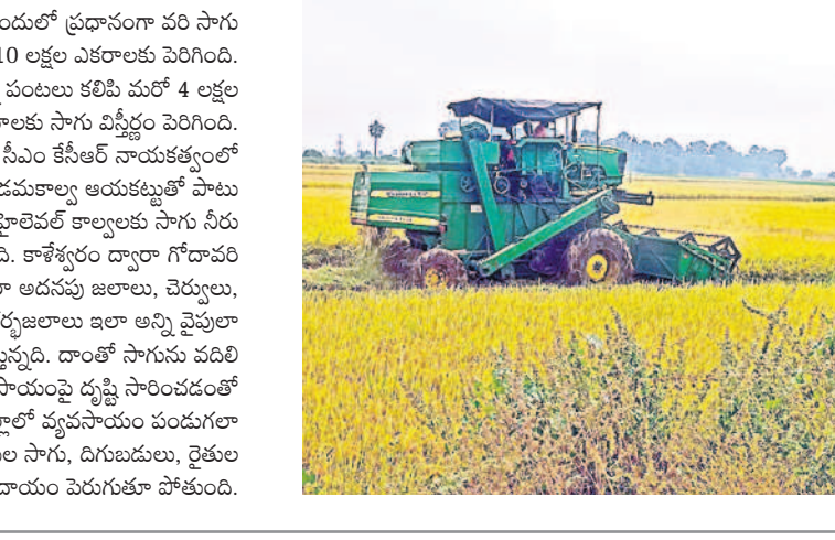
గమనార్హం. ఇందులో ప్రధానంగా వరి సాగు విస్తీర్ణమే 9.10 లక్షల ఎకరాలకు పెరిగింది.

సాగు విస్తీర్ణం రెట్టింపు గమనార్హం. ఇందులో ప్రధానంగా వరి సాగు విస్తీర్ణమే 9.10 లక్షల ఎకరాలకు పెరిగింది. మిగతా అన్ని పంటలు కలిపి మరో 4 లక్షల ఎకరాలకు సాగు విస్తీర్ణం పెరిగింది. స్వరాష్ట్రంలో సీఎం కేసీఆర్ నాయకత్వంలో నాగార్జునసాగర్ ఎడమకాల్వ ఆయకట్టుతో పాటు ఏఎంతేవీ లోలివల్, హైలెవల్ కాల్వలకు సాగు నీరు అందుబాటులోకి వచ్చింది. కాశీశ్వరం డ్యామా గోదావరి జిల్లాలు, మూసీ డ్యామా అడపపు జిల్లాలు, చెరువులు, కుంటల డ్యామా భూగర్భజలాలు ఇలా అన్ని వైపులా సాగునీరు పుష్కలంగా అభివృద్ధి. దాంతో సాగునీరు వరి విశేష వారంతా తిరిగి వ్యవసాయంపై దృష్టి సారించడంతో ఉమ్మడి నల్లగొండ జిల్లాలో వ్యవసాయం పండుగలా సాగుతున్నది. ఏటికేడు పంటల సాగు, దిగుబడులు, రైతుల ఆదాయం పెరుగుతూ పోతుంది.