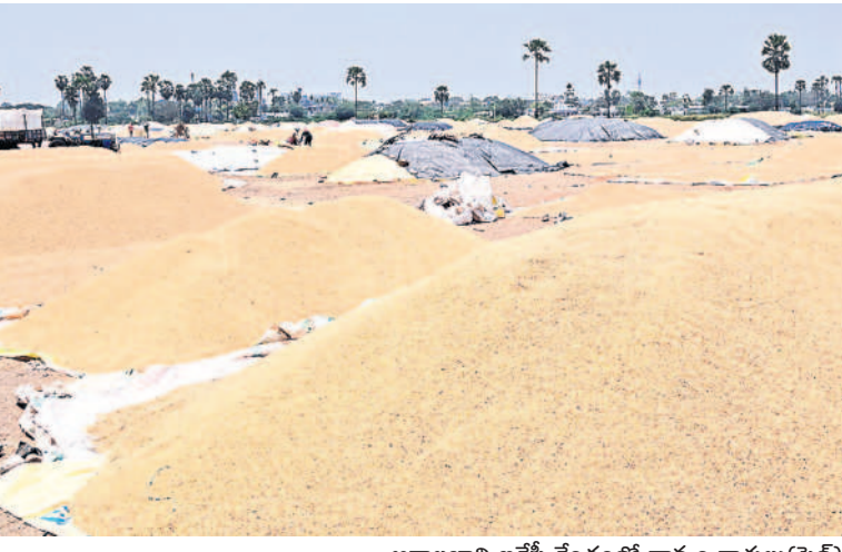
ఆర్థాలబావి ఇతేవీ కేంద్రంలో ధాన్యం రాతులు (ఫైల్)

నల్లగొండ ప్రతినది, డిసెంబర్ 12 (నమస్తే తెలంగాణ) : సమైక్య పాలనలో కరువు జిల్లాగా ముద్రపడిన నల్లగొండ జిల్లా రూపురేఖలు స్వరాష్ట్రంలో పూర్తిగా మారిపోయాయి. రాష్ట్రం సాధించిన తొలి ఏడాది నుంచే నాగార్జునసాగర్ ఆయకట్టుకు కృష్ణాజలాల్లోని నీటి వాటాను వినియోగిస్తూ రెండు పంటలకు సాగునీరు అందించడం ప్రారంభమైంది. ఆ తర్వాత కాశీశ్వరం జిల్లాలు తోడయ్యాయి. అంతేకాకుండా 2018 నుంచి వ్యవసాయానికి అందిస్తున్న 24 గంటల కరెంటు సరఫరా మరింత పురోభివృద్ధికి బాటలు వేసింది. రైతన్నకు ధైర్యం కల్పిస్తూ పెట్టుబడి సాయం తోడ్పడింది. ఇవన్నీ వెరసిన వరి సాగులో ఉమ్మడి నల్లగొండ జిల్లా డాన్యంగా రంగా మారింది.