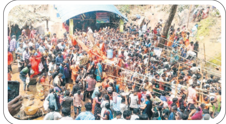
ఆలయం వద్ద కిక్కిరిసిన భక్తులు

అశ్వాసాపుడి, డిసెంబర్ 13 : తెలంగాణ- ఆంధ్ర ప్రదేశ్ రాష్ట్రాల సరిహద్దు పూర్తిగా అటవీప్రాంతంలో ఉన్న గుబ్బల మంగమ్మ ఆలయం భక్తుల కోర్కెలు తీర్చే అమ్మవారిగా ప్రసిద్ధి చెందింది. ఆలయంపై జాలువారే జలపాతం ప్రత్యేక ఆకర్షణగా నిలుస్తున్నది. ప్రకృతి సోయగాల మధ్య పచ్చని వాతావరణం భక్తులకు పారవశ్యంతోపాటు ఆహ్లాదాన్నిస్తున్నది. అమ్మవారి సేవలో కొండరెడ్డి గిరిజనులు పూజలు చేయడమే కాకుండా భక్తులకు సేవలు అందిస్తున్నారు. ప్రకృతి సిద్ధంగా స్వయంభువుగా వెలిసిన గుబ్బల మంగమ్మ తల్లి ఆలయం పర్యాటక కేంద్రంగా దినదినాభివృద్ధి చెందుతున్నది. ప్రతిపటాల్కుల మంది భక్తులు అమ్మవారిని దర్శించుకుని మొక్కులు తీర్చుకుంటున్నారు. తెలంగాణ రాష్ట్రం భద్రాద్రి కొత్తగూడెం జిల్లా అశ్వాసాపుడి పట్టణం మండలం, ఆంధ్రప్రదేశ్ రాష్ట్రం ఏలూరు జిల్లా బుట్టూరుగూడెం మండలం సరిహద్దులోని దట్టమై అటవీప్రాంతంలో గుబ్బల మంగమ్మ తల్లి శతాబ్దాల క్రితం స్వయంభుగా వెలిసి భక్తులకు దర్శనమిస్తున్నది. కోర్కెలు తీర్చే ఆరాధ్యదేవతగా భక్తులకు నిత్యం అమ్మవారు దర్శనమిస్తారు. తెలంగాణ, ఆంధ్రప్రదేశ్ రాష్ట్రాల వ్యాప్తంగా అమ్మవారిని దర్శించుకునేందుకు భక్తులు భారీగా తరలివస్తారు. నిత్యం దర్శనమిచ్చే అమ్మవారికి ప్రతి ఆదివారం, బుధవారం రోజు భక్తులు అధికసంఖ్యలో మొక్కులు తీర్చుకునేందుకు తరలివస్తారు.