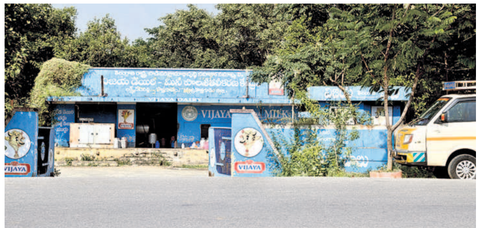
పాల సేకరణ కేంద్రం

భద్రాద్రి జిల్లాలో 60 పాల సేకరణ కేంద్రాలు ప్రతిరోజు 3 వేల లీటర్ల మిల్క్ సేకరణ 10 వేల మంది పాడి రైతులకు లబ్ధి వారిని ప్రోత్సహించేందుకు పథకాలు అమలు