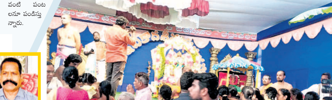
రామయ్యను దర్శించుకుంటున్న భక్తులు

పాలకు రోజు రోజుకూ డిమాండ్ పెరగడంతో ఎక్కువ మంది జీవావలం పెంచుకునేందుకు ఆసక్తి చూపిస్తున్నారు. జిల్లా పరిధిలోని ఎంపీ బంజర, రెడ్డిపాలెం, లక్ష్మీపురం, సుశాతనగల్, కొత్తగూడెం వంటి ప్రాంతాల నుంచి డెయిరీ యాజమాన్యం ఎక్కువగా పాలను సేకరిస్తున్నది. అత్యధికంగా ఎంపీ బంజర నుంచి ఓ పాడి రైతు 500 లీటర్ల పాలను కేంద్రానికి తరలిస్తున్నారు. పశుపోషణ కోసం కొండరు సర, జనుమ వంటి పంటలను పండిస్తున్నారు.