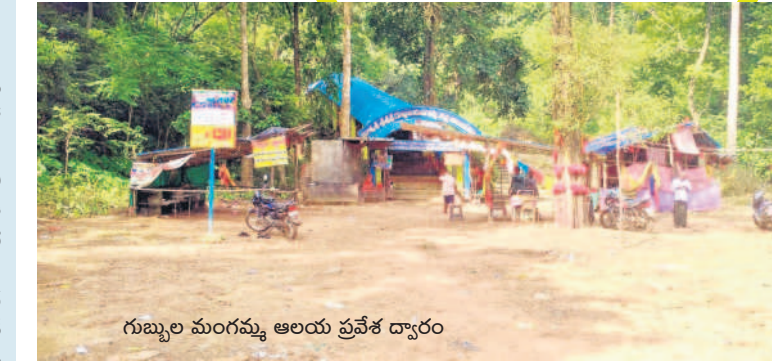
గుబ్బల మంగమ్మ ఆలయ ప్రవేశ ద్వారం

దట్టమైన అటవీప్రాంతంలో ఉన్న గుబ్బల మంగమ్మ ఆలయం అంతా ప్రకృతి అందాలతో భక్తులను ఆకర్షిస్తున్నది. ఆలయంలోకి ప్రవేశించే దుకు సుమారు 5 కిలోమీటర్ల ముందే అటవీ మార్గం ప్రారంభమవుతుంది. పచ్చని ప్రకృతి అందాలు భక్తులకు స్వాగతం పలుకుతాయి. మట్టి రోడ్డు గుండా ఆలయం వద్దకు భక్తులు చేరుకుంటారు. భారీ వృక్షాలు, పక్షుల కిలకిలలు, పెద్ద రాళ్లు, ఎత్తైన కొండలు, కాల్బాట పక్కనే పారే వాగు, ప్రశాంతమైన వాతావరణం భక్తులను కనువిందు చేస్తాయి. వేసవికాలంతోపాటు ఏడాది పొడవునా ఆలయంపై జాలువారే జలపాతం భక్తులు, పర్యాటకులకు ఆహ్లాదాన్ని పంచుతున్నది. జలపాతం నుంచి వచ్చే శబ్దాలు సంగీతంలా భక్తులు ఆస్వాదిస్తుంటారు. జాలువారే జలపాతం కింద భక్తులు స్నానాలు ఆచరించి అమ్మవారికి మొక్కులు తీర్చుకుంటారు. ఆలయంపై పారే జలపాతం ఎక్కడ నుంచి వస్తుందో నేటికీ అంతపట్టిన రహస్యం.