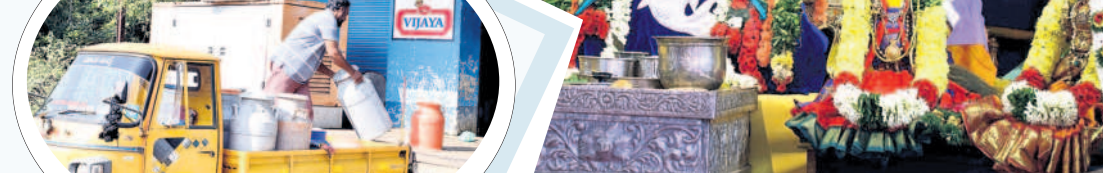
లక్ష్మీదేవిపల్లిలో పాలు సేకరణ కేంద్రం