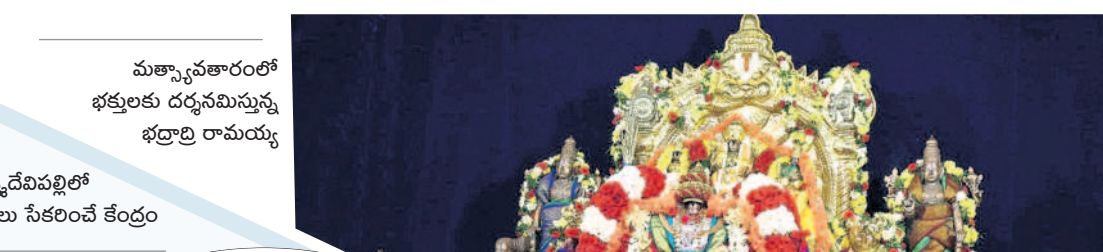
మత్స్యావతారంలో భక్తులకు దర్శనమిస్తున్న భద్రాద్రి రామయ్య