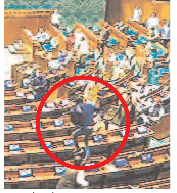
లోక్సభలో బెంచులపైనుంచి దుంకుతున్న దుండగుడు

గురువారం THURSDAY 14.12.2023 కరీంనగర్ KARIMNAGAR పేజీలు: 12+8 Pages: 12+8 విధియ గురువారం, సూర్యోదయం: 6-87, సూర్యాస్తమయం: 5-48. శ్రీ శోభాకర్ నామ సంవత్సరం దక్షిణాయనం హేమంత రుతువు మార్గశిర మాసం శుక్ల పక్షం తిథి: విలియం రాత్రి 12-57 వరకు. నక్షత్రం: మూల ఉదయం 9-46 వరకు, తమిళ పూర్వాషాఢ. వర్షం: ఉదయం 8-17 నుంచి ఉదయం 9-47 వరకు, పునర్ వర్షం: సాయంత్రం 8-45 నుంచి రాత్రి 8-14 వరకు. రాహుకాలం: పగలు 1-38 నుంచి పగలు 2-56 వరకు. దుర్భుధార్యం: ఉదయం 10-19 నుంచి ఉదయం 11-04 వరకు, పునర్ దుర్భుధార్యం: పగలు 2-45 నుంచి పగలు 3-29 వరకు. అమృతకాలం: తెల్లవారుజామున 8-41 నుంచి తెల్లవారుజామున 5-11 వరకు.