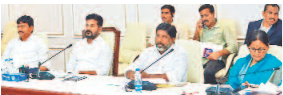
ధరణి పనితీరు, భూ సంబంధిత అంశాలపై సమీక్షిస్తున్న సీఎం రేవంత్, బిజెపిలో డిప్యూటీ సీఎం భట్టి తదితరులు

ధరణిపై సమగ్ర నివేదిక అందించండి.. సమీక్షలో సీఎం రేవంత్, బిజెపిలో డిప్యూటీ సీఎం భట్టి తదితరులు