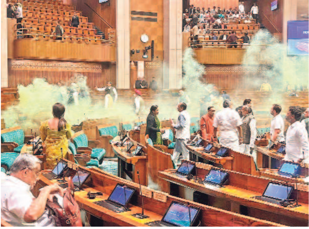
లోక్సభలో పాగ వదిలిన దుండగులను అడ్డుకొనేందుకు యత్నిస్తున్న ఎంపీలు, అధికారులు

గురువారం THURSDAY 14.12.2023 కరీంనగర్ KARIMNAGAR పేజీలు: 12+8 Pages: 12+8 విధియ గురువారం, సూర్యోదయం: 6-87, సూర్యాస్తమయం: 5-48. శ్రీ శోభాకర్ నామ సంవత్సరం దక్షిణాయనం హేమంత రుతువు మార్గశిర మాసం శుక్ల పక్షం తిథి: విలియం రాత్రి 12-57 వరకు. నక్షత్రం: మూల ఉదయం 9-46 వరకు, తమిళ పూర్వాషాఢ. వర్షం: ఉదయం 8-17 నుంచి ఉదయం 9-47 వరకు, పునర్ వర్షం: సాయంత్రం 8-45 నుంచి రాత్రి 8-14 వరకు. రాహుకాలం: పగలు 1-38 నుంచి పగలు 2-56 వరకు. దుర్భుధార్యం: ఉదయం 10-19 నుంచి ఉదయం 11-04 వరకు, పునర్ దుర్భుధార్యం: పగలు 2-45 నుంచి పగలు 3-29 వరకు. అమృతకాలం: తెల్లవారుజామున 8-41 నుంచి తెల్లవారుజామున 5-11 వరకు.