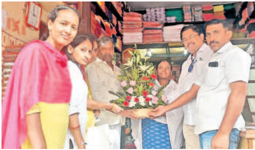
పద్మారావును కలిసి శుభాకాంక్షలు తెలుపుతున్న జీహెచ్ఎంసీ యూసీడి విభాగం అధికారులు