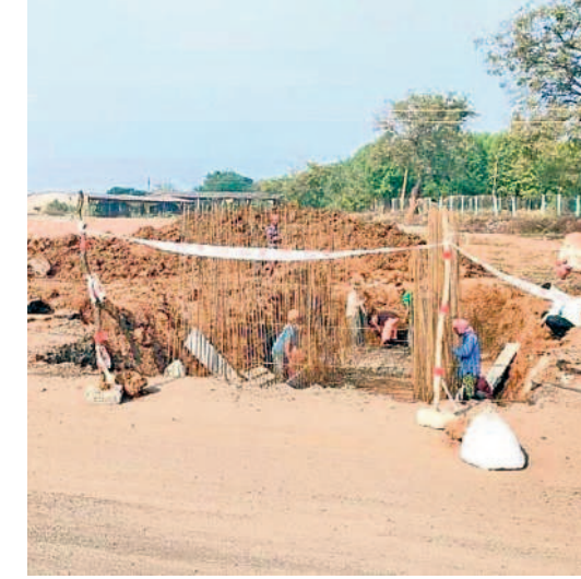
మల్లంపల్లి వద్ద ఎన్హెచ్ కొనసాగుతున్న కల్వర్టు పనులు