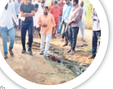
దుర్గమ్మ కాలనీలో డైనేజీ పరిశీలన..