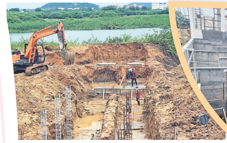
శుభ్రనీటిని తుమ్మలకుంట చెరువులోకి మళ్లించేందుకు నిర్మిస్తున్న బెట్ లెట్ పైపులైన్