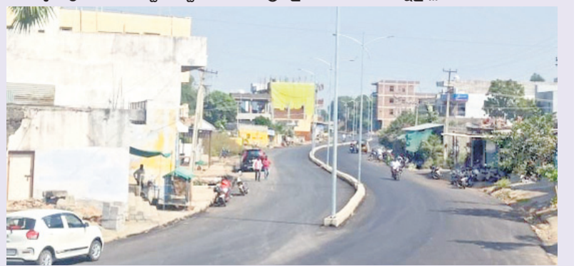
మహాత్మాగాంధీ విగ్రహం నుంచి పూర్తయిన జిటీ రోడ్డు నిర్మాణం