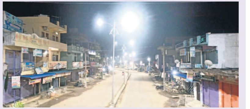
అంబేద్కర్ విగ్రహం నుంచి ఆర్టీసీ బస్టాండ్ వరకు సెంట్రల్ లైటింగ్ తో వెలుగుతున్న లైట్లు