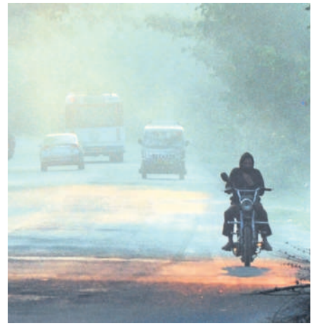
మంచుతెరల మధ్య వెళ్తున్న వాహనదారులు