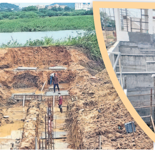
నిర్మాణంలో ఉన్న జిల్లినేషన్ ట్యాంక్