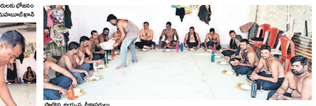
పాల్వేపల్లి అయ్యప్ప దీక్షాపరులు