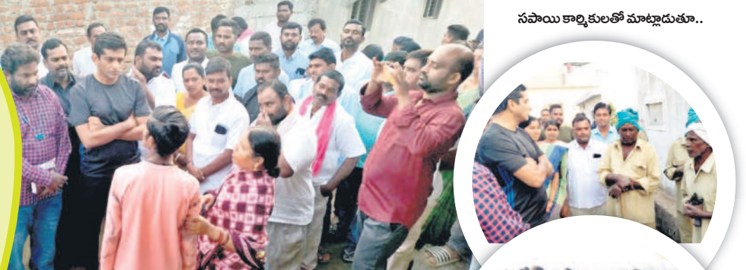
మల్లాపూర్ లోని గాంధీనగర్ కాలనీలో ప్రజలను సమస్యలు అడిగి తెలుసుకుంటున్న కోర్టు ఎమ్మెల్యే సంజయ్ కల్వకుంట్ల