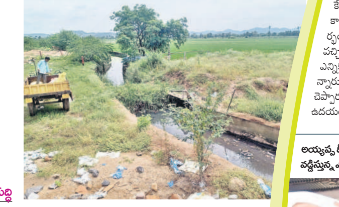
పట్టణ నివాసాల నుంచి వచ్చే మురుగు నీటి కోసం బిల్డియా ఏర్పాటు చేసిన కాలనీ

వస్త్ర పరిశ్రమకు కేంద్ర బిందువైన సిరిసిల్లా పట్టణ జనాభా 1.10లక్షలకు, 22,000 నివాసాలున్నాయి. ఇందులో ముఖ్యంగా మరమ్మగాలు, అద్దం (డ్రయింగ్) పరిశ్రమలు, సైజింగ్లు, అనుబంధ, ఇతర పరిశ్రమలు ఉన్నాయి. నివాసాలు, పరిశ్రమల నుంచి 3.19 మిలియన్ల మురుగు నీరు రోజు వెలువడుతుంది. ఈ నీటిని శుద్ధి చేయమండగా, భవిష్యత్ అవసరాలను దృష్టిలో ఉంచుకుని 19.3 లీటర్ల నీటిని రీసైకింగ్ చేసి సామర్థ్యంతో ఫ్లాంట్ ను నిర్మించారు. ఎస్టీసీ ఫ్లాంట్ కు వంద మీటర్ల దూరంలోని డైనేజీ ఇన్ లెట్ చాంబర్ (ఇఅండ్ డి) ప్రక్రయని ఏర్పాటు చేస్తున్నారు. మురుగునీరులో వచ్చే చెత్తా చెదారం జాలి వద్ద ఆగిపోతుంది. నీటిని రాసీలెట్ సెప్టర్లోకి మళ్లిస్తారు. అందుకు 33 ఫీట్ లోతు, సుమారు వంద ఫీట్ల వెడల్పుతో పెద్ద బావి (సంపు) నిర్మించారు. ఇందులో 195 హెచ్పీ సామర్థ్యం గల మోటారు 1, 45 హెచ్పీల సామర్థ్యం గల 4 మోటార్ల ద్వారా నీటిని ఎత్తిపోస్తారు. మురుగునీటిలోని బ్యాక్టీరియాను తొలగిస్తారు. కోంనేషన్ కాంటాక్ట్ ట్యాంక్ లో నీటిని శుద్ధి చేసి, బెంబెల్ వైపులైన్ ద్వారా తుమ్మలకుంట చెరువులోకి మళ్లిస్తారు. పంట చేలకు, ఇతర అవసరాలకు ఈనీటిని వినియోగించుకునే అవకాశం ఉంటుంది అధికారులు చెబుతున్నారు. ఫ్లాంట్ నిర్మాణ పనుల పర్యవేక్షణ బాధ్యతను పట్టికే డిపార్ట్ మెంట్ కు అప్పగించారు. పనులను హైదరాబాద్ ఉన్నతాధికారుల బృందం ఎప్పటికప్పుడూ పరిశీలిస్తూ నాణ్యతా ప్రమాణాలు పాటించేలా చర్యలు తీసుకుంటున్నది. యంత్రాలు అమర్చి ట్రయల్ రన్ కు ఏర్పాట్లు చేస్తున్నారు.