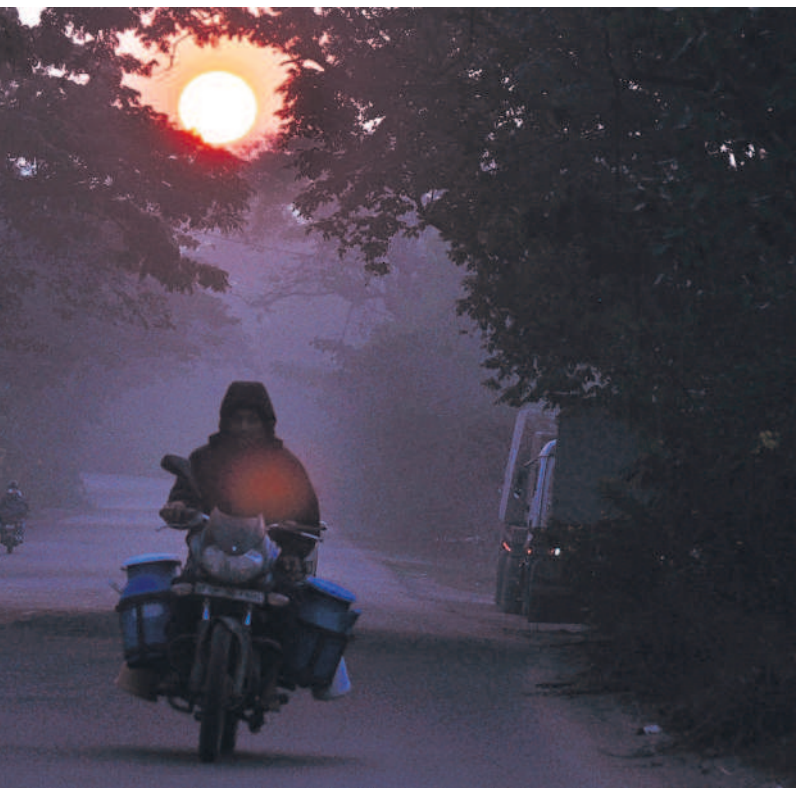
అలుగునూరు - వరంగల్ రహదారిపై మంచులో వెళ్తున్న పాల వ్యాపారి