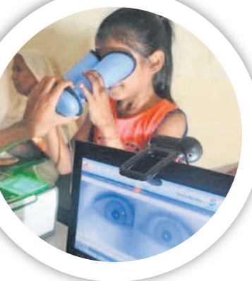
మీసీఎ నంబర్లో అప్డేట్ చేసుకుంటున్న ప్రజలు

ఉచితంగా ఆన్లైన్ చేసుకునే విధానాన్ని ఒకసారి పరిశీలిస్తే.. ఉదాహరణ పోర్టల్లో https://myaadhaar.uidai.gov.in ఆధార్ నంబర్ ద్వారా లాగిన్ కావాలి. ప్రొసీడీ టూ అప్డేట్ అప్డేట్ క్లిక్ చేయాలి. ఆధార్ రిజిస్ట్రేషన్ మొబైల్ నంబర్ కు ఓటిపీ వస్తుంది. ఓటిపీ ఎంటర్ చేసిన అనంతరం డాక్యుమెంట్ అప్డేట్ క్లిక్ చేయాలి. వివరాలు స్క్రీన్ పై వస్తాయి. వాటిని పూర్తిగా పరిశీలించి, సవరణ ఉంటే చేయాలి. లేదంటే ఉన్న వివరాలతోనే నెక్స్ట్ పై క్లిక్ చేయాలి. కిందకు స్క్రోలింగ్ చేస్తే ప్రూఫ్ ఆఫ్ ఇడెంటిటీ, ప్రూఫ్ ఆఫ్ ఆడ్రస్ డాక్యుమెంట్లను ఎంచుకోవాలి. ఆయా డాక్యుమెంట్లను స్కాన్ చేసి అప్లోడ్ చేయాలి. సబ్మిట్ బటన్ పై క్లిక్ చేయాలి. పద్నాలుగు అంకెల అప్డేట్ రిజిస్ట్రేషన్ నంబర్ వస్తుంది. దీని ద్వారా స్టేట్స్ తెలుసుకోవచ్చు.