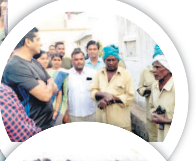
సపాయి కార్మికులతో మాట్లాడుతూ..

మల్లాపూర్, డిసెంబర్ 13 : కోర్టు ఎమ్మెల్యే డాక్టర్ సంజయ్ కల్వకుంట్ల ప్రజా సమస్యల పరిష్కారం కోసం సరికొత్తగా 'మన ఊరికి-మన ఎమ్మెల్యే' కార్యక్రమం చేపట్టారు. బుధవారం వేకువ జామున అధికారులు, ప్రజాప్రతినిధులతో కలిసి మల్లాపూర్ మండల కేంద్రంలోని దుర్గమ్మ కాలనీ, గాంధీనగర్ లోని ఇంటింటూ తిరుగుతూ కాలనీలో నెలకొన్న సమస్యలను అడిగి తెలుసుకున్నారు. ఈ సందర్భంగా ఎమ్మెల్యే మాట్లాడుతూ, నియోజకవర్గ ప్రజలకు ఏ సమస్య వచ్చినా తన దృష్టికి తీసుకువస్తే పరిష్కారానికి కృషి చేస్తానని తెలిపారు. ఎన్దుకల సమయంలో ఇన్సూరెన్స్ హామీను నేరవేర్చడానికి కృషి చేస్తానన్నారు. నిరంతరం ప్రజలకు అందుబాటులో ఉండి సేవలందిస్తానని చెప్పారు. ప్రజా సమస్యల పరిష్కారమే తన ప్రధాన ఏజెండా అని, నిత్యం ఉదయం వేళలో గ్రామాల్లో పర్యటించి సమస్యల పరిష్కారానికి కృషి చేస్తా